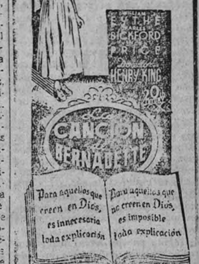
Y 23 primeras figuras de la pantalla mundial TOLERADA MENORES

Cinco premios de la Academia de Hollywood, incluido el de "La mejor interpretación del año a JENNIFER JONES"