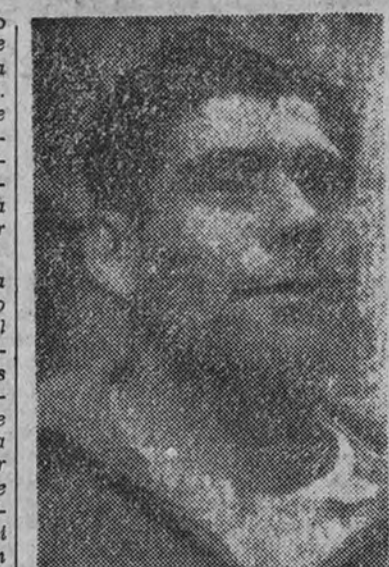
El popular corredor portugués Rebello, que es uno de los más probables candidatos a la victoria en la dilatada Vuelta Ciclista a Portugal