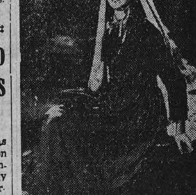
Jennifer Jones, el último y más sensacional descubrimiento del cine norteamericano. Su actuación en "La canción de Bernadette", que se estrenará en el Palacio de la Música, la ha situado a la cabeza de las más admiradas "estrellas".