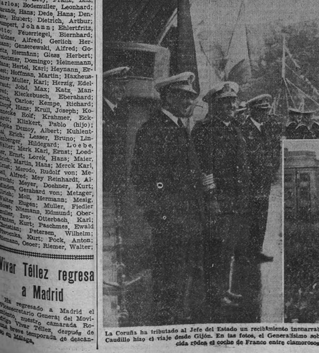
La Coruña ha tributado al Jefe del Estado un recibimiento inenarrable. Millares de personas acudieron al puerto para esperar la llegada del crucero «Galicia», en el que el Caudillo hizo el viaje desde Gijón. En las fotos, el Generalísimo sobre la cubierta del barco, en el momento de atracar en el puerto de la capital gallega.—La multitud enardecida rodea el coche de Franco entre clamorosos vítores.—Un aspecto del puerto momentos antes de la llegada del «Galicia»