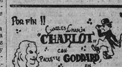
Por fin!! CHARLOT. Con GODARD.

"La canción de Bernadette" es el nombre de todos los públicos. En ella se sigue la vida de la niña que, en un momento de la predicción, Bernadette Soubirou, hija de un humilde molinero. Jamás el cine ha abarcado un tema tan maravilloso, con tanto tacto y primer de detalles, que alienta al espectador en los ambientes y los hechos, como si fuera un testigo —presencial—. Ni jamás se acirra ha pagado a la altura que Jennifer Jones en el difícil papel de protagonista. "La canción de Bernadette", orgullo del cine moderno, será presentada muy pronto en el Palacio de la Música como lo que es: un acontecimiento sin precedentes en la historia del séptimo arte.