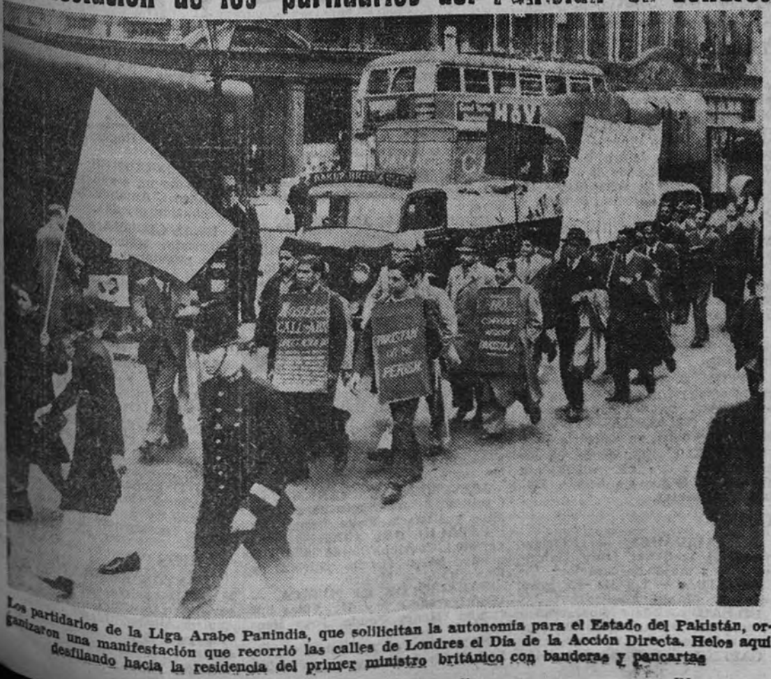
Los partidarios de la Liga Árabe Panindia, que solicitan la autonomía para el Estado del Pakistán, organizaron una manifestación que recorrió las calles de Londres el Día de la Acción Directa. Helos aquí desfilando hacia la residencia del primer ministro británico con banderas y pancartas.