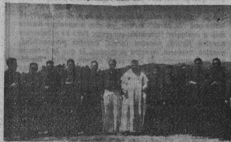
El Delegado Nacional del Frente de Juventudes y los capellanes y seminaristas del Campamento Nacional "Francisco Franco"

El espíritu, en la ciudad, vive como pájaro cautivo en jaula de oro, entre el vicio y la mentira y un cúmulo de exigencias desmesuradas. Necesita salir al campo para lanzar al viento, sin trabas, su canto sonoro. Estos son los Campamentos del Frente de Juventudes: lugares de liberación y de rescate, ventanas