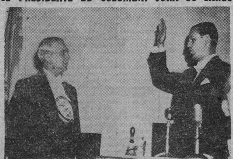
El nuevo Presidente de Colombia, doctor don Mariano Ospina Pérez, en el momento de prestar juramento como Jefe del Estado ante el presidente del Parlamento colombiano