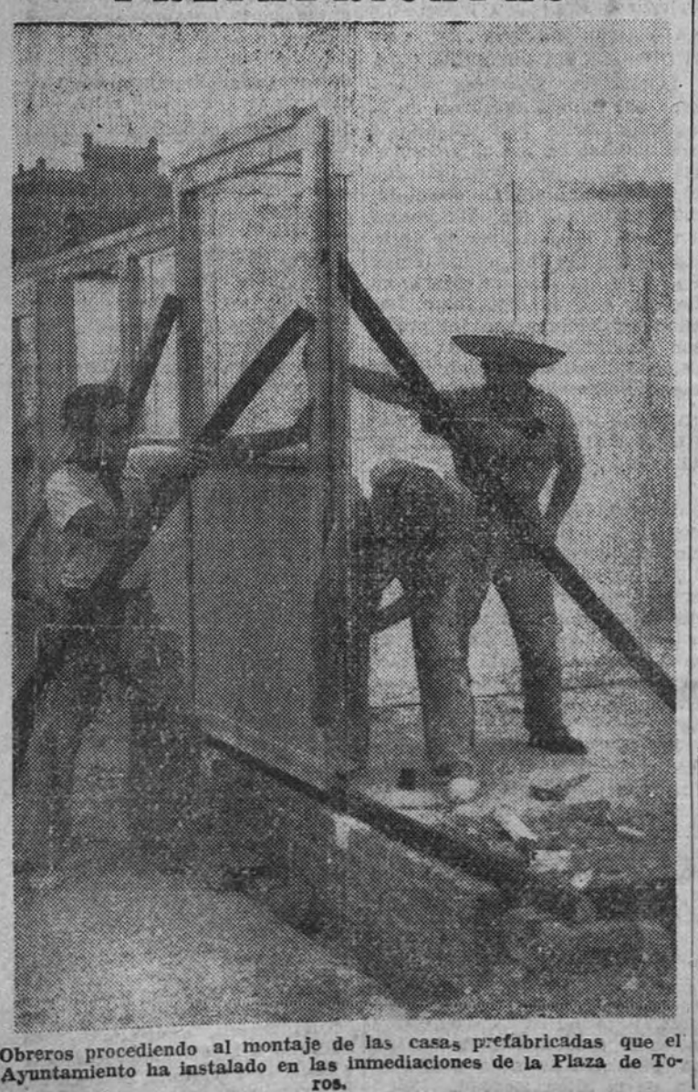
Obreros procediendo al montaje de las casas prefabricadas que el Ayuntamiento ha instalado en las inmediaciones de la Plaza de Toros.