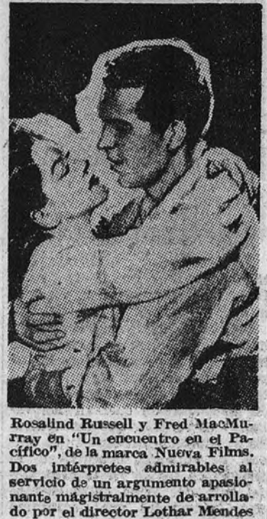
Rosalind Russell y Fred MacMurray en «Un encuentro en el Pacífico»