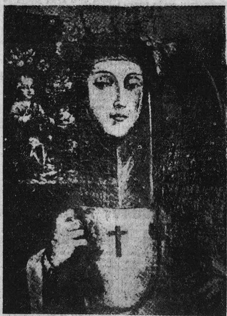
Retrato de Santa Rosa, existente en el convento de Rosa de Santa María de Lima