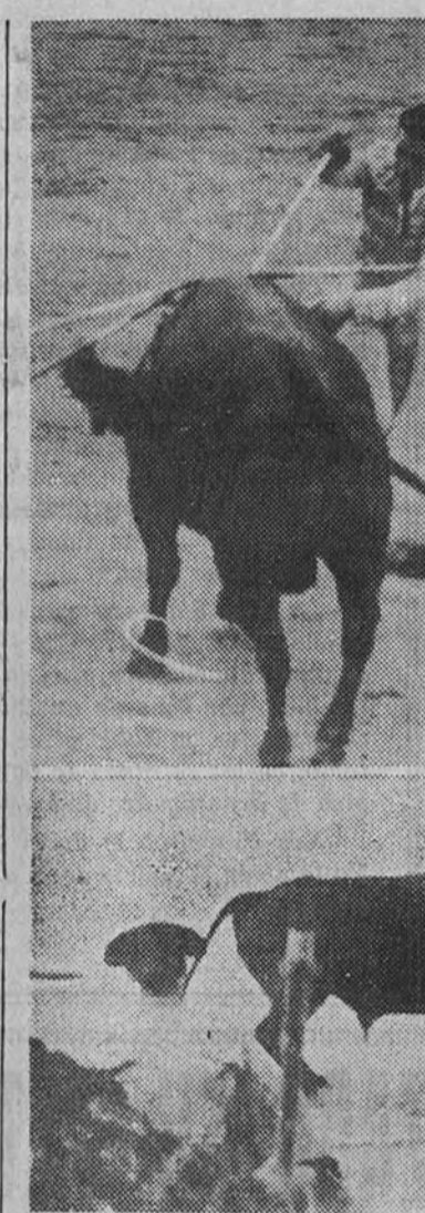
Rafael Vázquez en su faena de muleta; el mismo novillero, cogido por uno de sus toros, y Navarro en un derechazo