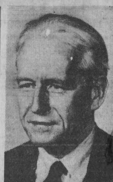
Hans von Hoesslin

Todas las vacaciones han estado un poco pendientes de estos días. Siempre fui aficionado a los ensayos de orquesta, porque en ellos sólo en ellos—más ahora que no hay humo de cigarrillos ni demasiado burbujeo de charla—puede acercarse uno a las mismas orillas de la creación. Hemos de defendernos cada día más de una postura exagerada de pasividad ante la música: quisiera yo que cada concierto tuviese su vispera de gozo, su aura de veneración y misterio que los libros y los comentarios, es el derecho a la misma música, verla charcar, aunque el valván de las paradas y de las repeticiones sea un tanto enemigo de la nueva forma de sucesión temporal organizada por la música. Ya somos tertulianos, no legión, los asistentes a los ensayos que, burlando, nos dan lo imposible: concierto de orquesta en la intimidad.