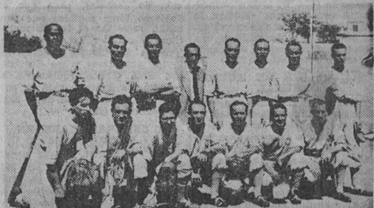
El equipo del Español, que ayer derrotó al Hércules en la semifinal del Campeonato de España y que el domingo jugará con el Barcelona la final de esta competición.

Mayor cantidad de aficionados que en los días precedentes asistió ayer al campo de Vallecas para presenciar los partidos semanales del Campeonato nacional de pelota base, Español-Hércules y Barcelona-Real Madrid.