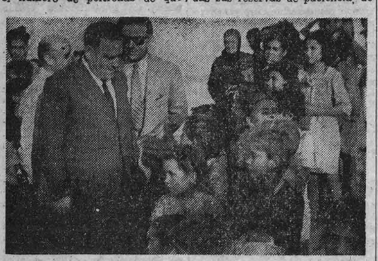
En la arena, de la playa de Marbella, cara al mar, enfrentado con la más pavorosa miseria y la más ingenua infancia.

De siempre, uno de los puestos más difíciles que han existido en la política española es el de Gobernador Civil de Barcelona. Dotado, en ese escalafón ideal de cargos que nunca se escribió, pero que estuvo presente en todo momento en el espíritu de los aspirantes, de una categoría parangal a la de Ministro, ofrece a la buena voluntad de quien le sirva los escollos de una poltrona ministerial multiplicados por el número de poltronas de que