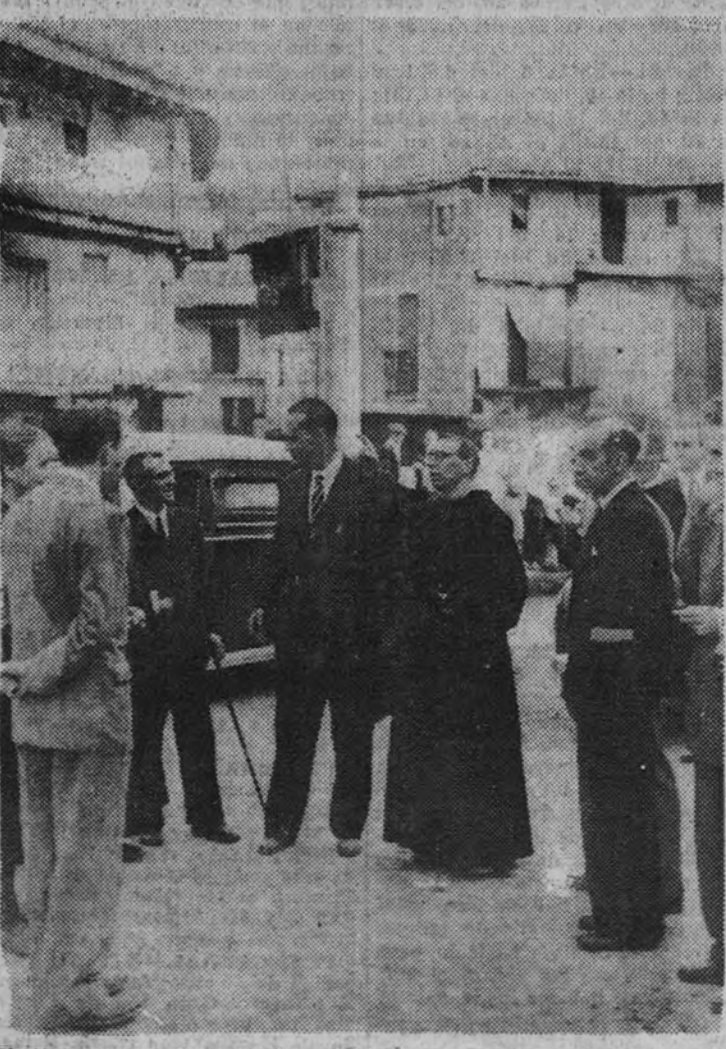
El Ministro de la Gobernación, presidente del Patronato Nacional de las Hurdes, visita en Las Mestas el Hospital y Asilo de Ancianos, recientemente organizado por él, en el corazón de las Hurdes