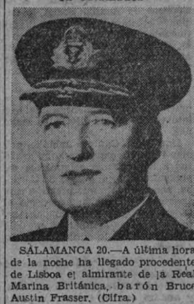
SALAMANCA 20.—A última hora de la noche ha llegado procedente de Lisboa el almirante de la Real Marina Británica, barón Bruce Austin Fraser