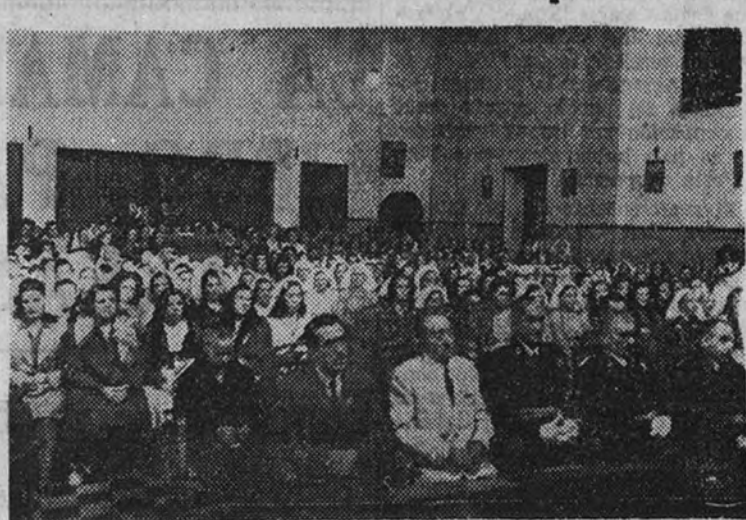
En la capilla de la Prisión Provincial de Mujeres, se celebró una solemne función religiosa con motivo de la festividad de Nuestra Señora de la Merced.

Con motivo de la festividad de Nuestra Señora de la Merced, Patrona del Cuerpo de Prisiones y de los penados, se celebraron ayer en las cárceles diversos actos.