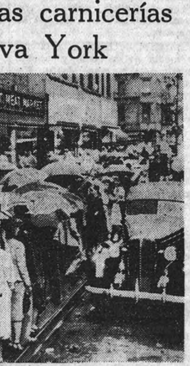
Estos habitantes de Nueva York, que desde el amanecer esperan a pie firme en la calle 14, aguardando la lluvia durante horas y horas, están satisfechos, en medio de tanta incomodidad, porque acaban de establecer un nuevo récord: el de «colas para carne».