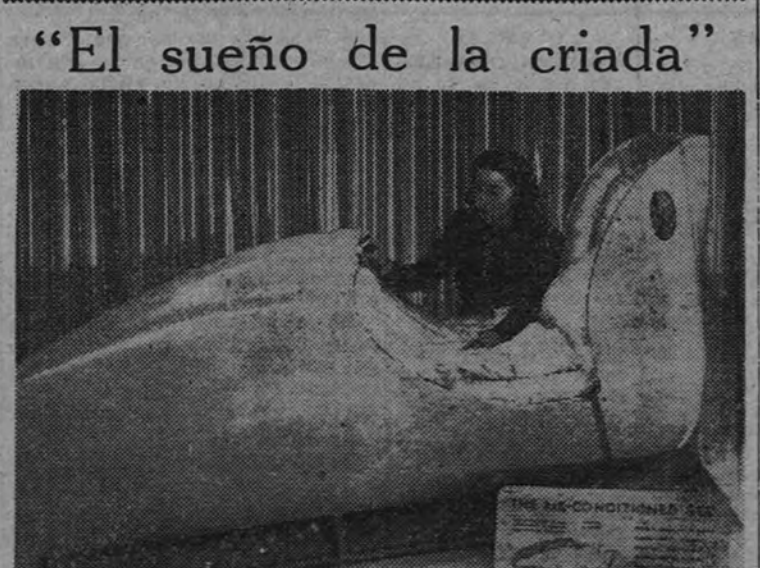
Esta especie de zapapilla gigante figura en la Exposición "Lo que la Gran Bretaña puede hacer". Por lo visto, la Gran Bretaña puede fabricar esto, que, como fácilmente no se puede ver, es una cama con acondicionamiento de aire refrigerado y caliente, cuya principal ventaja es que no necesita hacerse todos los días. Los ingleses la han bautizado como "el sueño de la criada"; pero, si realmente es tan cómoda como dicen, también se podría llamar "el sueño de la señorita". De esta se, por ejemplo.

Es más, que posible que el actual comisario para la Justicia del Pueblo sea verdugo profesional y adorne su rico atuendo con el hacha ejecutoria de reglamento. Asimismo, el comisario de Orden público, reclutado entre las más puras y eficaces vanguardias del "gang", será presumiblemente un caballero con dos o tres fusiles, ametralladores en cada mano y, por cuanto hace a la puntilla, con seis o siete mil diplomas de honor adquiridos en los tiros de pichón de Chicago, ejercicio un tanto violento que se practica allí entre la buena sociedad a la salida de los Bancos.