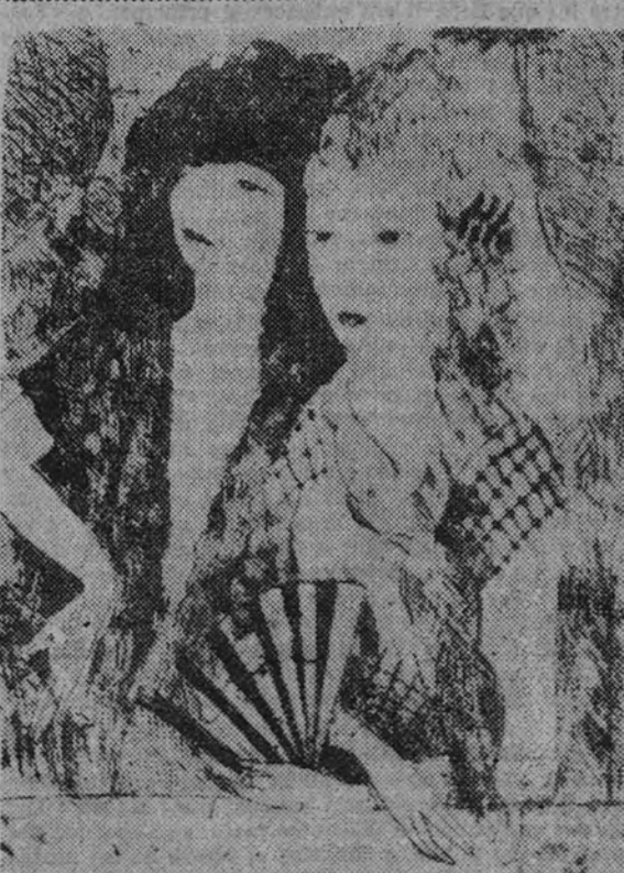
«Españolas» por María Laurencia

fortaleza desde la que combatir, había buscado asilo a la sombra de la iglesia o del castillo feudal. Desde que la Academia existe, la que fundó Richelieu en 1634, es el espíritu que otorga el título de colegas a los gentileshombres. (Por una vez la hipérbole, paraíso del vándalo, talla con regularidad sus frotillas.) La Academia en todo caso es la sede de la literatura, que domina allí a la sociedad y al Estado. Sainte Beuve, en su lección de apertura de la Escuela Normal en 1838, dijo que la tradición humanística de su pueblo es como esas vías romanas, visibles aún, que atravesaban ancho todo el Imperio y conducían a Roma. Descendientes de romanos—aseveraba—o hijos de adopción de la raza latina,