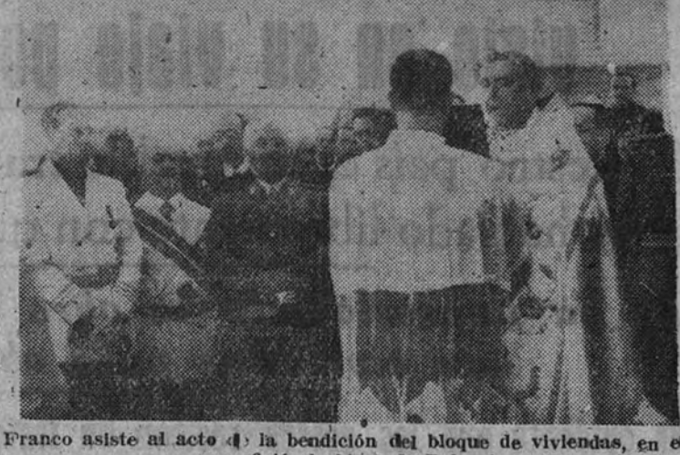
Franco asiste al acto de la bendición del bloque de viviendas, en el que ofició el obispo de Palencia.

El Caudillo, cuyo coche marchaba a paso lento, siguió hacia el pantano de Villameca, al que llegó a las seis y cuarto de la tarde. Le esperaban las autoridades locales y representaciones de las Hermandades y Cofradías de Regantes, así como el jefe de la Confederación Hidrográfica. El Caudillo conversó extensamente y se