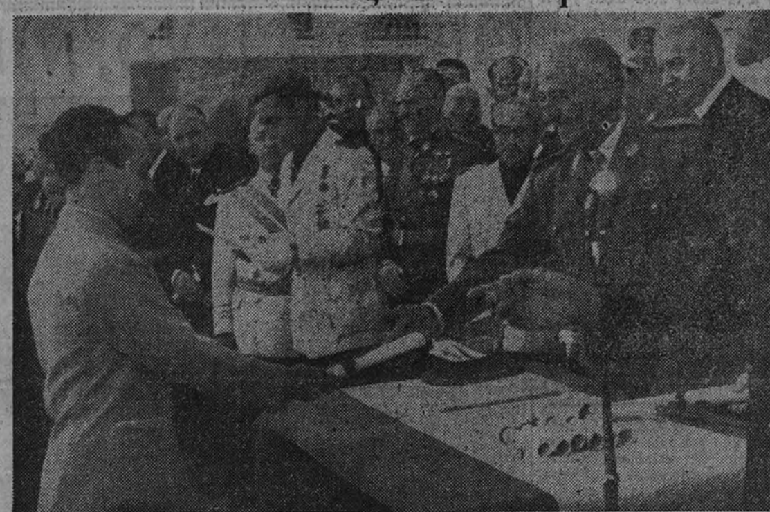
Su Excelencia el Jefe del Estado entrega los títulos de propiedad a los beneficiarios de las casas construidas por la Obra Sindical del Hogar

CALUROSO RECIBIMIENTO El coche entró en Palencia a marcha lenta, impuesta por la multitud entorpecida que invadía por completo la carretera. En todas las calles del recorrido el vecindario en masa tributó calurosas ovaciones al Caudillo, y cuando el coche que ocupaba Su Excelencia