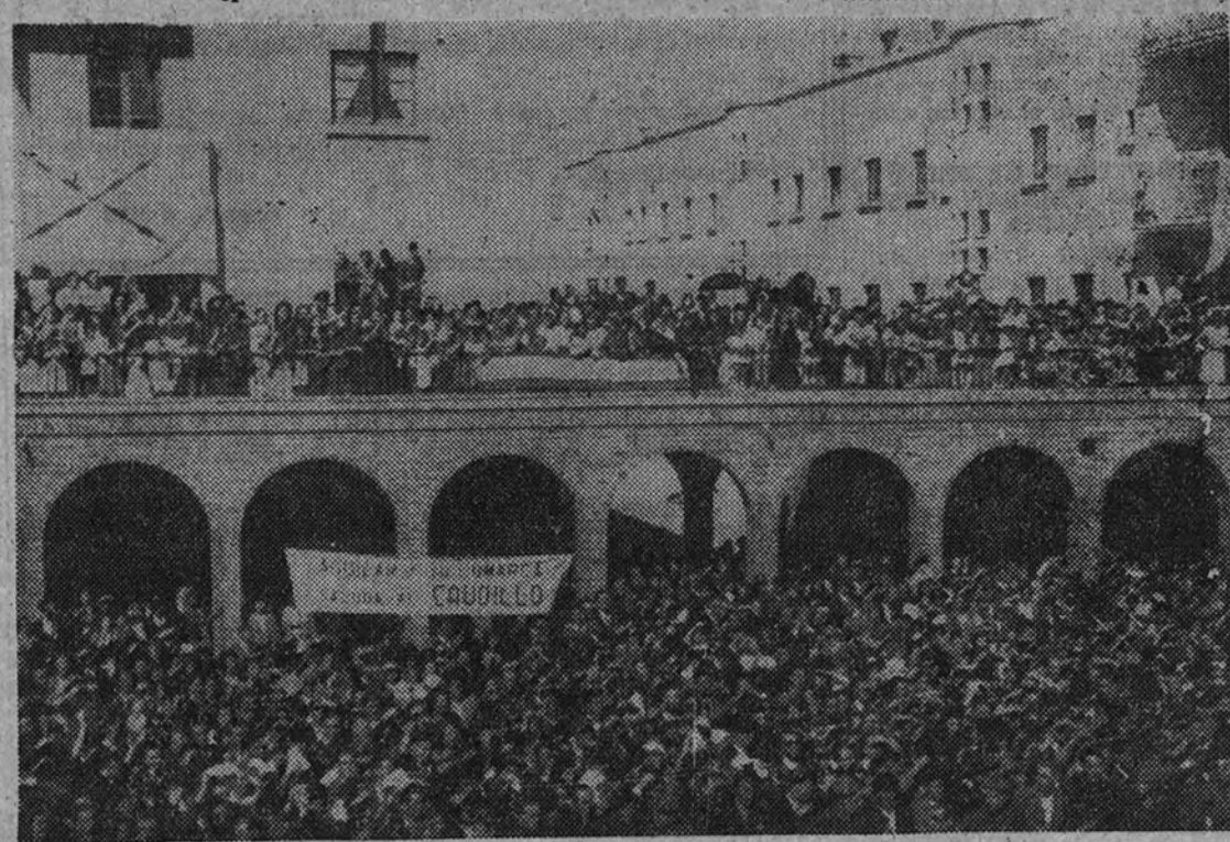
Aspecto del bloque de viviendas que fué inaugurado por el Generalísimo.

Oficiará el acto de la bendición el obispo de Zamora, doctor Font y Andrú. La agua de la presa regará por la margen izquierda del canal de San José, los términos de Castronuño y Villafraña, en la provincia de Valladolid, y los de Toro, Peleaganzo, Villalazán, Villaralbo y Zamora, y por la derecha, extensas zonas de ambas provincias, en una longitud de 70 kilómetros. (Mencheta.)