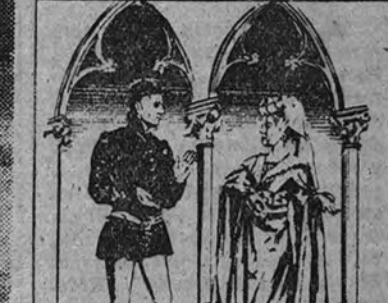
Reproducimos un fotograma de la producción inglesa en color "Enrique V", creación de Laurence Olivier. Chamartín prepara su estreno para fecha inmediata