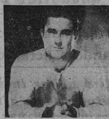
Greg MacClure es el protagonista de "El coloso de Boston", producción United Artists que distribuye Cepicsa