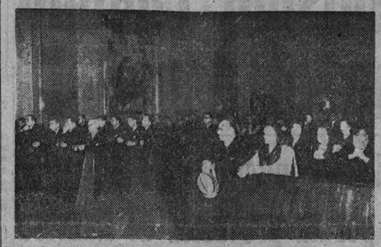
El Ministro de Educación Nacional, acompañado de su esposa, preside el acto de la bendición de la Iglesia del Espíritu Santo

Ofició el obispo de Madrid, asistiendo el Ministro de Educación y numerosas representaciones científicas