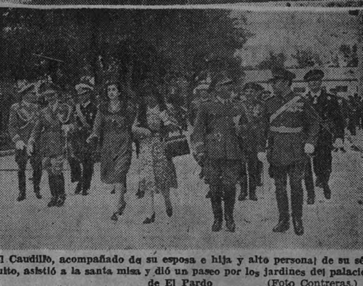
El Caudillo, acompañado de su esposa e hija y alta personal de su séquito, asistió a la santa misa y dió un paseo por los jardines del palacio de El Pardo

Con motivo de la fiesta onomástica del Caudillo se celebraron en El Pardo diversos actos que revistieron gran brillantez. Con asistencia del Gobierno, obispo de Madrid-Alcalá y las más altas representaciones del Ejército, Jefe del Ministerio, generales y jefes con mando de la guarnición, se celebró una misa de campaña en el patio del cuartel de las tropas de la Casa Militar, que oyeron Su Excelencia