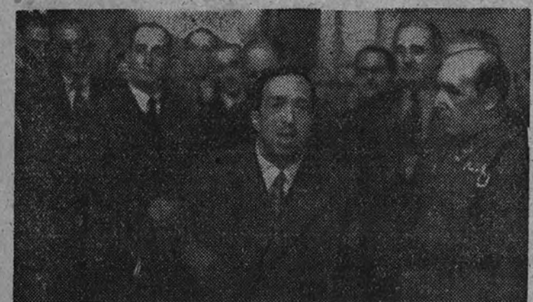
El director general de Seguridad durante las palabras que dirigió a los funcionarios de su departamento que acudieron a felicitarle