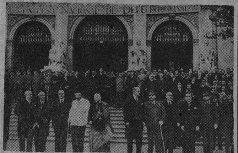
El Presidente de las Cortes, el Capitán General de la región y otras personalidades presiden el desfile de las tropas, que les rindieron honores en el acto inaugural del Congreso.

Después de una detenida visita y de un cambio de impresiones con el rector de la Universidad, el señor Esteban Bilbao se retiró de la Facultad de Derecho, y, acompañado