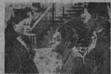
Una escena del maravilloso film "Semilla de odio", que muy pronto se estrenará en un lujoso cine de esta capital