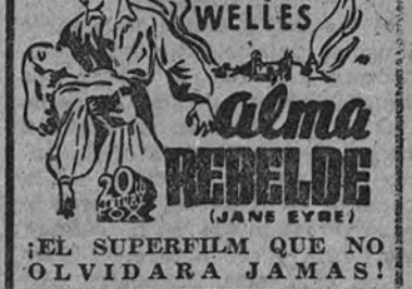
ALMA REBELDE (JANE EYRE) EL SUPERFILM QUE NO OLVIDARÁ JAMÁS!

LA OBRA CUMBRE DE LA CINEMATOGRAFIA INGLESA "Enrique V" ha sido considerada por todos los críticos mundiales como la obra cumbre de la cinematografía inglesa. El actor mayor de esta película, producida, dirigida e interpretada por Laurence Olivier, es, sin duda, el no haberse apartado ni un ápice de la obra de Shakespeare. Toda la magia del diálogo del inmortel dramaturgo inglés, seguida fielmente a lo largo del film, ha quedado plasmada en una riquísima gama de imágenes del más espléndido colorido.