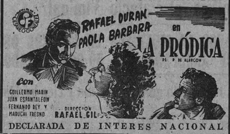
DECLARADA DE INTERES NACIONAL