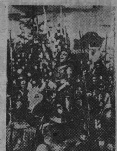
La cinematografía inglesa ha logrado su mejor producción con "Enrique V", dirigida e interpretada por Laurence Olivier