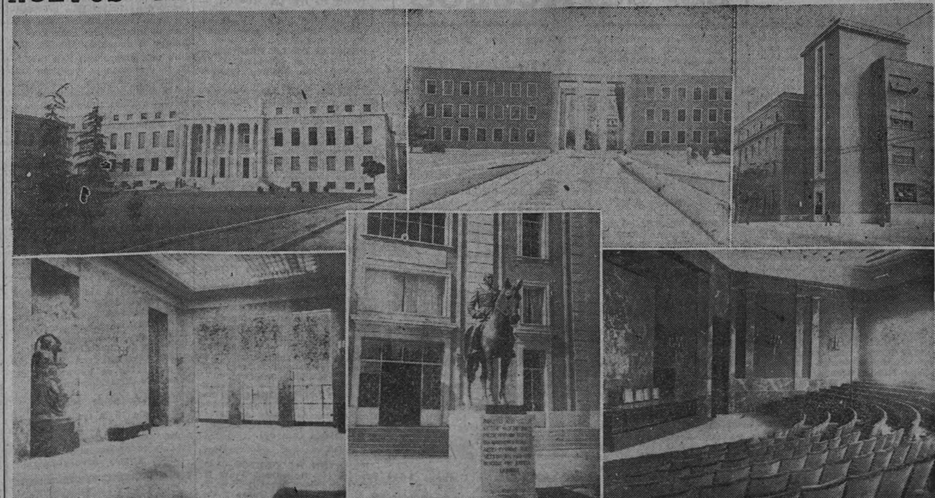
El día 12, con motivo de la celebración de la Fiesta de la Hispanidad, serán inaugurados en Madrid los nuevos edificios del Consejo Superior de Investigaciones Científicas. En nuestra información gráfica: Una vista del edificio central o pabellón de Gobierno, en el que se celebrará el solemne acto inaugural. Pabellón de Farmacología y Geofísica, entre los cuales se ven los grandes arcos de acceso al recinto. El Instituto «Torres Quevedo», de Física. Hall del edificio central. Uno de los pabellones del Instituto «Ramón de Maetius», delante del cual se ve la estatua ecuestre del Caudillo. Y salón de actos del pabellón de Gobierno.