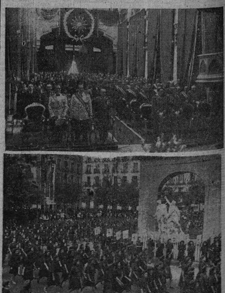
El Cuerpo de Intendencia celebró con una solemne fiesta religiosa el día de su Patrona, Santa Teresa de Jesús, y la Sección Femenina celebró también otro importante acto en honor de la Santa de Ávila en la plaza del Dos de Mayo. (Información en la página segunda.)