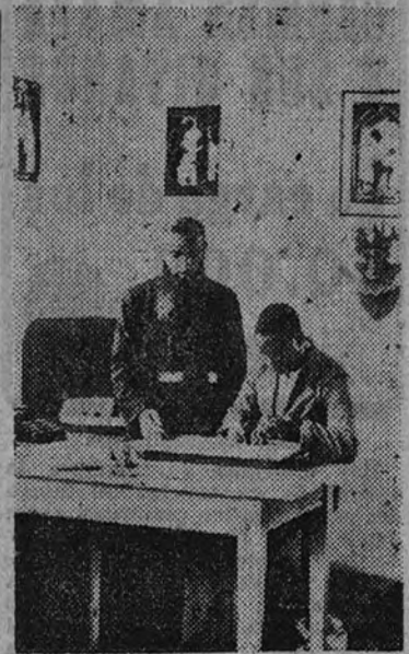
Un capuchino enseña dibujo a un muchacho de raza negra

Hemos entrado en la semana del Domund, lo que quiere decir que se aproxima el gran día de la catolicidad, esa esplendorosa jornada en la que, de uno a otro confín del mundo, los pueblos realizan un esfuerzo gigantesco para prestar su ayuda a las Misiones por medio de la Obra de la Propagación de la Fe. España no puede dejar de oír esa voz paternal de la Iglesia llamando a la caridad de todos los católicos para que presten su ayuda moral y material a la Obra de las Misiones. Y ello, primero y principalmente, porque nuestra Patria es esencialmente misionera y ha de hacer honor a su espíritu y a su estilo, que la llevó a las más asombrosas empresas. No hace años muchos días nos decía un sacerdote: "Aunque no tuviéramos todos los documentos de la Historia que avalan que el pueblo español es eminentemente misionero, los que nos dedicamos a la propaganda sabemos perfectamente que basta arañar en el espíritu de los españoles para encontrar con vetas riquísimas y purísimas de estas ansias misionerouniversalistas."