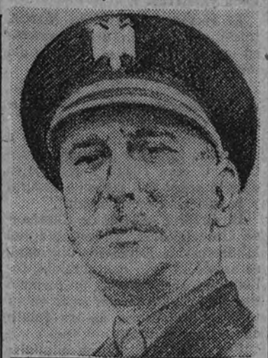
Don Emilio de Aspe Vaamonde

DON EMILIO DE ASPE VAAMONDE, nació en La Coruña en 1885, ingresó en la Academia de Caballería en 1904 y salió con el