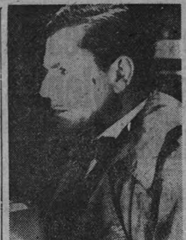
Warner Baxter, protagonista de "El oráculo del crimen", un interesante film policíaco que hoy se estrena en el Rex

BARCELONA 17.—El secretario nacional de Deportes ha cursado un telegrama al presidente de Peña Rhin, informándole de que el general Moscardó ha