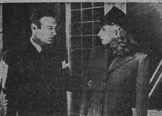
Vera Hrubá y Richard Arlen en una escena de la fantástica película "La mujer y el monstruo", que el próximo domingo será el público del suntuoso Palacio de la Prensa a partir de mañana lunes.