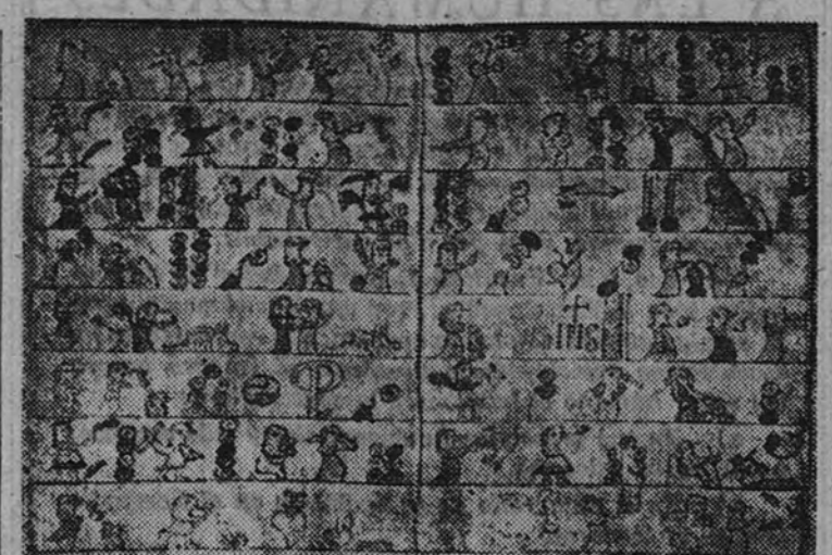
Catecismo en peregrino compuesto y dibujado por los PP. Dominicos en Nueva España

Fue San Francisco Javier quien primeramente llevó la luz del Evangelio al Japón, y fueron también jesuitas españoles quienes más tarde dieron su vida en el Celeste Imperio; pero esta provincia dependía de Portugal y no puede, por tanto, considerarse dentro de la expansión española hasta que desde Manila se empieza a intentar la entrada de misioneros en el Japón. Primero, el padre Cobo, y luego, fray Pedro Bautista, lograron la entrada en calidad de embajadores, más al poco tiempo nueve misioneros y quinientos seglares japoneses eran pasados por las espadas y crucificados. No dece el ánimo de los misioneros, y desde Filipinas llegan por docenas a estas tierras, donde les esperaba la cruz, el agua hirviendo, las cárceles, las horras y los peores suplicios. Se tiene que prohibir a los misioneros la marcha para el Japón, en vista de la crueldad persecución allí desencadenada; pero todos se inutil: los frailes arman sus barcos a escondidas y parten en busca del martirio; de este modo llegaron al Japón en 1639 28 franciscanos, y en 1641, un grupo de dominicos, sin que se volviera a saber nada de ellos.