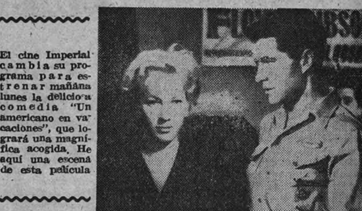
El cine Imperial cambia su programa para estrenar mañana lunes la deliciosa comedia "Un americano en vacaciones", que logrará una magnífica acogida. He aquí una escena de esta película.