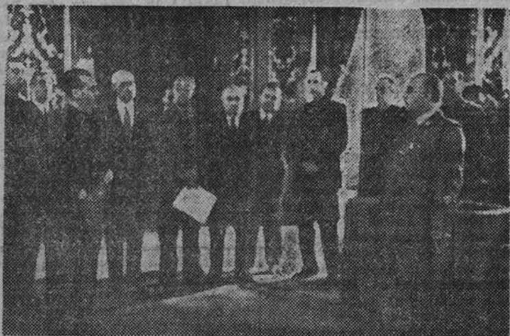
El Delegado Nacional de Sindicatos pronunciando su discurso ante Su Excelencia el Jefe del Estado.

Momentos después, desde el rellano de la escalera que se extiende ante los salones interiores, el Caudillo, acompañado por las expresadas jerarquías nacionales de