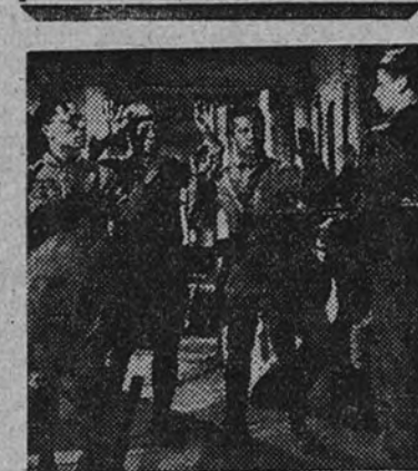
Una escena de "China", la superproducción que triunfa a diario en la pantalla del cine San Miguel.