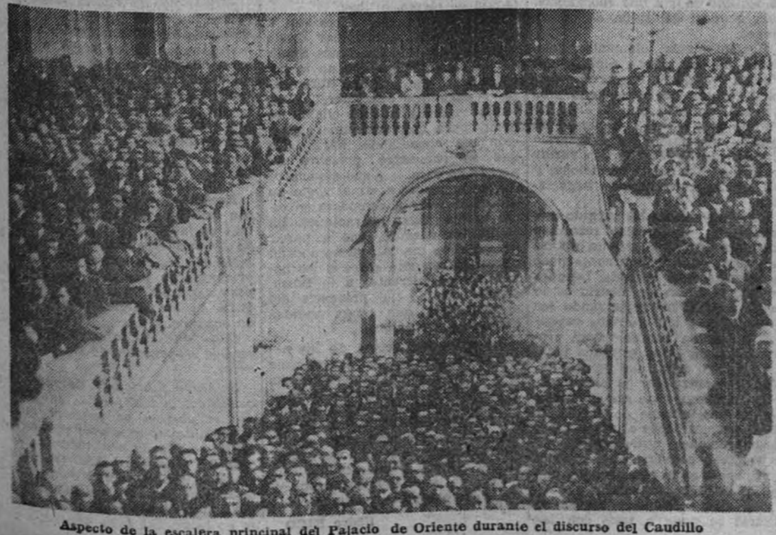
Aspecto de la escalera principal del Palacio de Oriente durante el discurso del Caudillo