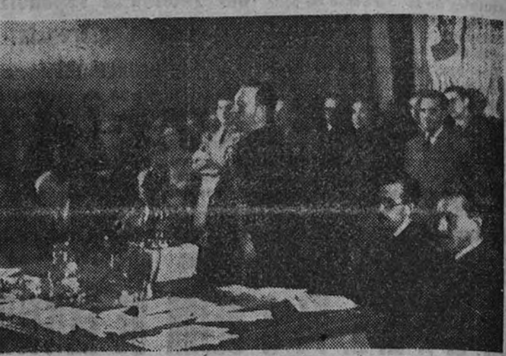
El Delegado Nacional de Sindicatos durante el desarrollo de su discurso pronunciado ayer en la clausura de la I Asamblea Nacional de Hermandades de Labradores y Ganaderos.