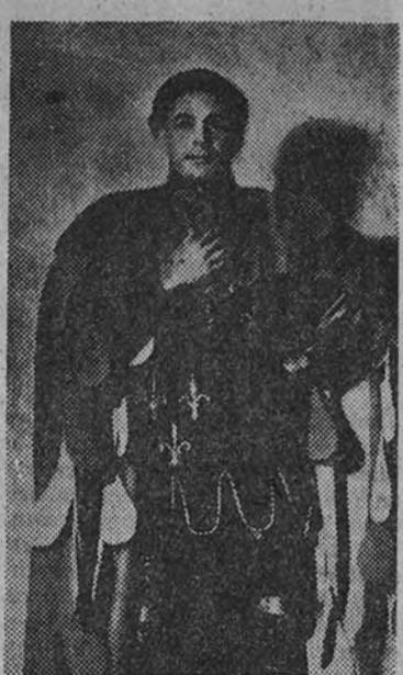
Laurence Olivier en «Enrique V»

escenográfica, que no es defecto de composición, sino reflejo de tapicerías de la época, de grabados incrustados en movimiento por el cine y para gloria del cine, que al recibir este homenaje plástico a la Historia se dignifica una vez más de tantas culpas como se han querido volcar sobre él.