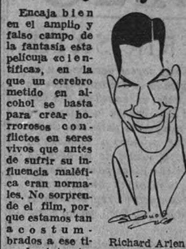
Encaja bien en el amplio y falso campo de la fantasía esta película científica, en la que un cerebro metido en alcohol se basta para crear horrores con fillos en seres vivos que antes de sufrir su influencia maldita eran normales. No sorprende el film, por que estamos tan acostumbrados a ese tipo de cintas terroríficas, que una más ya no pone nuestros nervios en tensión.

El efrankenstein protagonista de "La mujer y el monstruo" es un doctor de apariencia pacífica, que no ha necesitado caracterizarse.