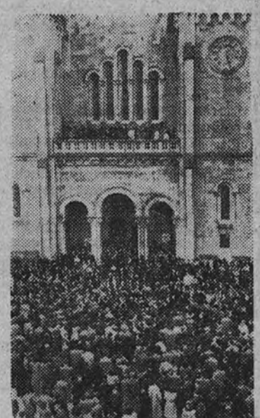
Cinco mil ex cautivos se concentraron en Covadonga para asistir a la solemne ceremonia de la ofrenda de la insignia de la Hermandad a la Virgen de Covadonga