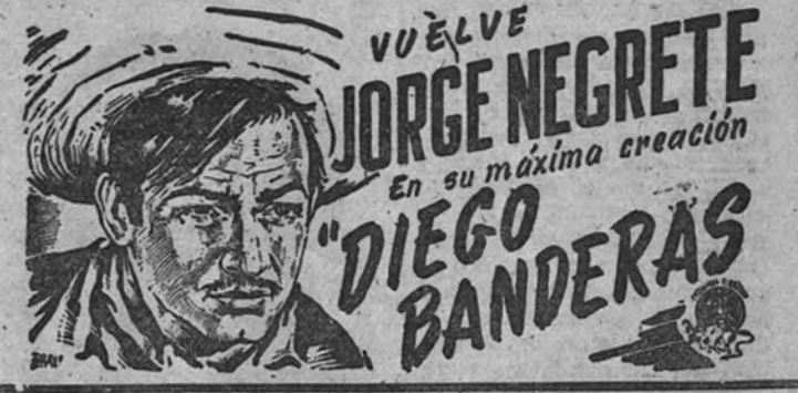
JORGE NEGRETE EN "DIEGO BANDERAS"

PALACIO DEL CINE Y PRINCIPE ALFONSO EL PROXIMO VIERNES