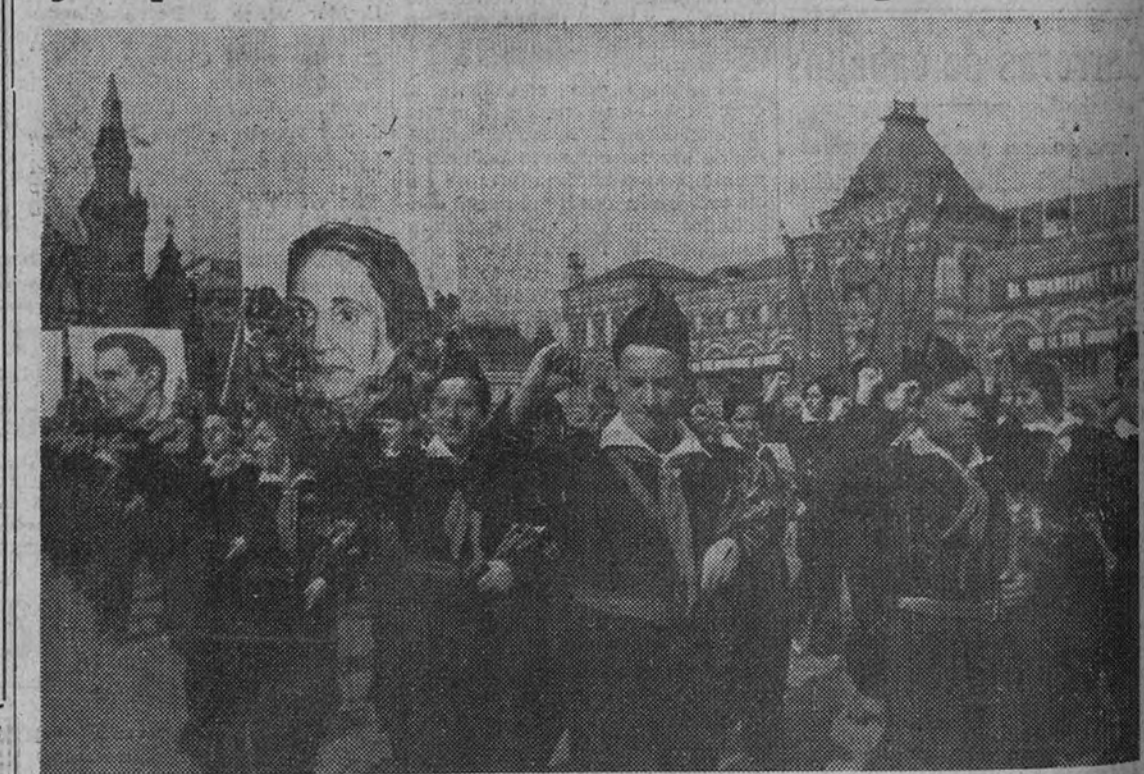
“L'Espanne Republicaine”, órgano oficial del José Giral, en su edición del 12 de octubre de 1946 publica lo siguiente:

“LOS NIÑOS ESPAÑOLES EN LA U. R. S. S.—Desde que el Ministerio de Emigración del Gobierno de la República española inició su gestión son muchas las personas y familias que se han dirigido al solicitando su intervención para que los republicanos españoles refugiados en la U. R. S. S. puedan salir de aquel país, y muy especialmente para que los niños que encontraron generosa acogida en Rusia durante los años de la guerra civil en España se reúnan con sus padres, residentes en Francia o en otros países distantes de la Unión Soviética.