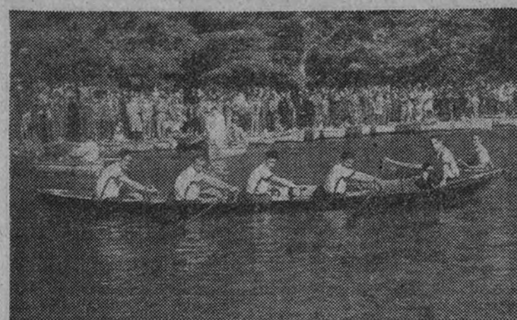
El batel de Sestao, que nuevamente conquista el Campeonato de España de bateles

tro y la Escuela al mismo nivel seguidos del Frente de Juventudes.