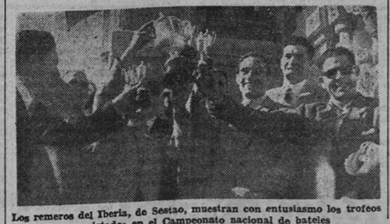
Los remeros del Iberia, de Sestao, muestran con entusiasmo los trofeos conquistados en el Campeonato nacional de bateles

El sábado próximo tendremos boxeo de nuevo. El local de celebración será esta vez el frontón Fiesta Alegre (Real Madrid), y en el programa figuran, hasta ahora Gascón y Nardechia.