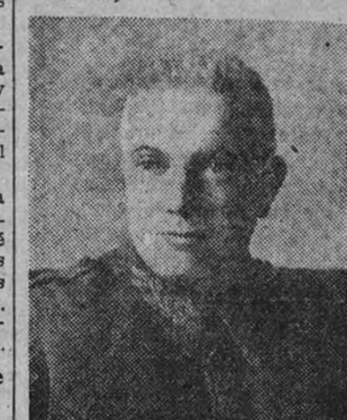
Coronel Díaz de Villegas

José Díaz de Villegas. "Estudio militar del terreno". (La Geografía y la Guerra). Imprenta del Servicio Geográfico del Ejército. 469 pág. 30 pesetas. Madrid, 1946.