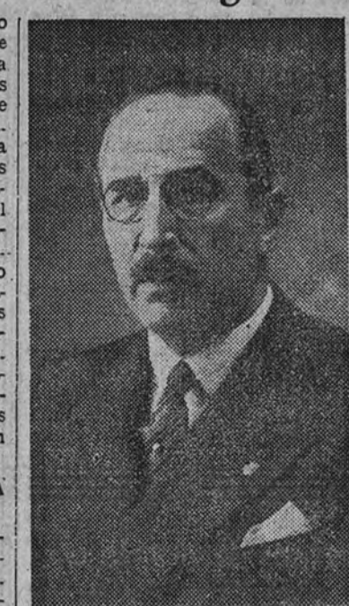
Doctor don José Arce

"Se trata de oponerse a la poca consideración que los países pequeños sufren en manos de los países grandes"