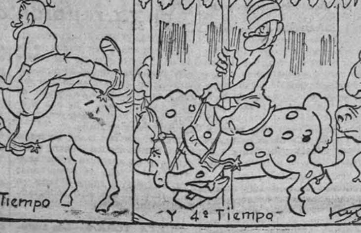
LECCION DE EQUITACION

En los medios financieros el conocimiento de estas noticias ha producido grata satisfacción. No producido grata satisfacción solamente porque la revalorización de la Telefónica está ya realizada, sino también porque se ha cumplido la promesa que ha hecho el Estado de mantener a la Telefónica bajo el régimen de empresa privada.