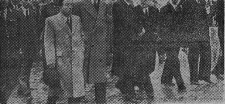
El Ministro de Educación Nacional con las personalidades que presidieron el entierro de doña Clementina Albéniz.

Fué presidido por el hijo de la finada, el Ministro de Educación Nacional, Alcalde de Madrid y otras personalidades