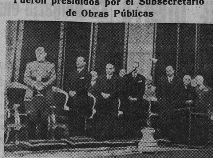
Presidencia de los solemnes funerales por los empleados y obreros de la R. E. N. F. E. fallecidos, durante el año, celebrados ayer en el templo nacional de Santa Teresa (Foto Contreras).

Fueron presididos por el Subsecretario de Obras Públicas