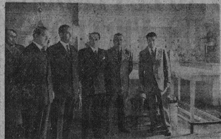
El Ministro de la Gobernación con las personalidades que inauguraron las nuevas instalaciones del Instituto de Hematología.

El señor Pérez González impuso condecoraciones a varios donantes de sangre