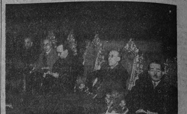
El Subsecretario de Educación Nacional, con otras personalidades, preside la solemne función religiosa celebrada en la iglesia de San Francisco el Grande con que comenzó la Asamblea.

En San Francisco el Grande se celebró una misa solemne