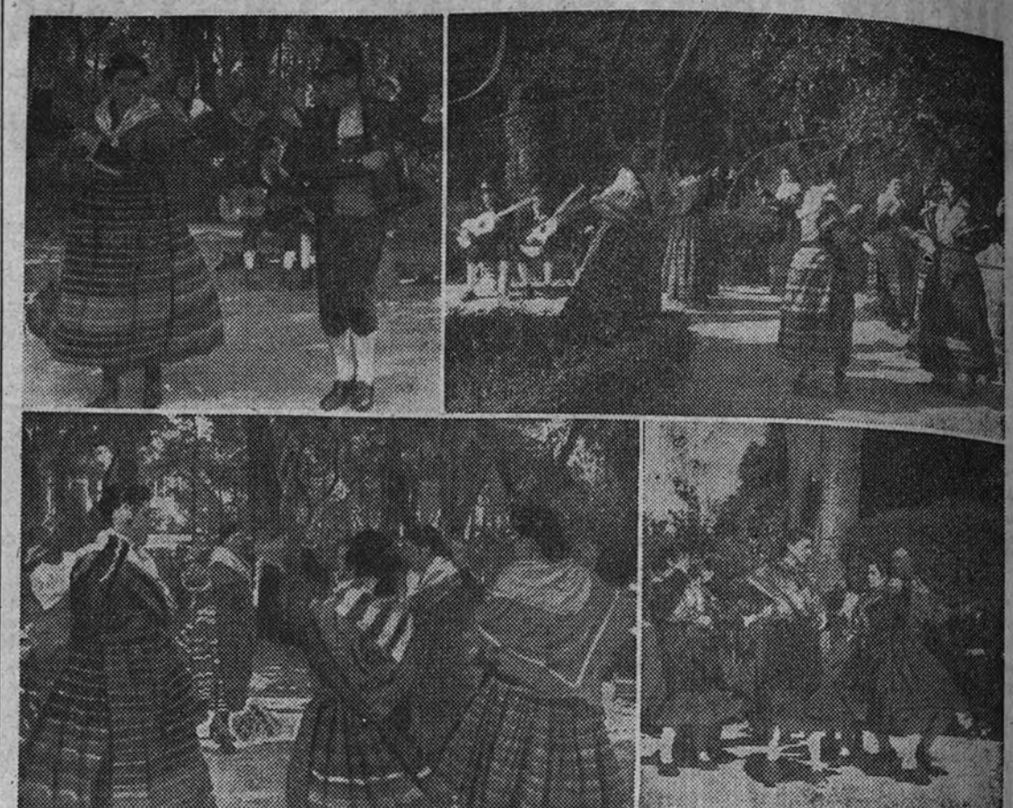
Coros y danzas de la Sección Femenina

La final de las pruebas, celebrada ayer, confirmó la eficaz labor de la Sección Femenina