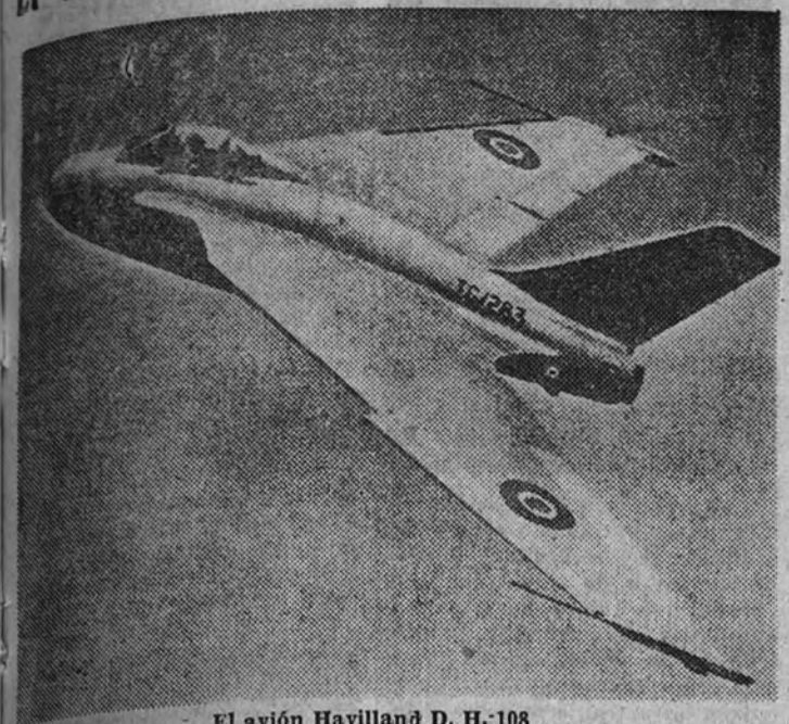
El avión Havilland D. H. 108

Como consecuencia del grave accidente ocurrido al Havilland-108 "Swallow", en el que perdió la vida el gran piloto de pruebas Geoffrey de Havilland, en el último de sus intentos—logrado, según la casa constructora—de batir el récord mundial de velocidad, sobrepasando los 1.000 kilómetros por hora, ha levantado en la Gran Bretaña una gran polvareda acerca de las posibilidades que con estos aviones del presente para rebasar la velocidad del sonido.