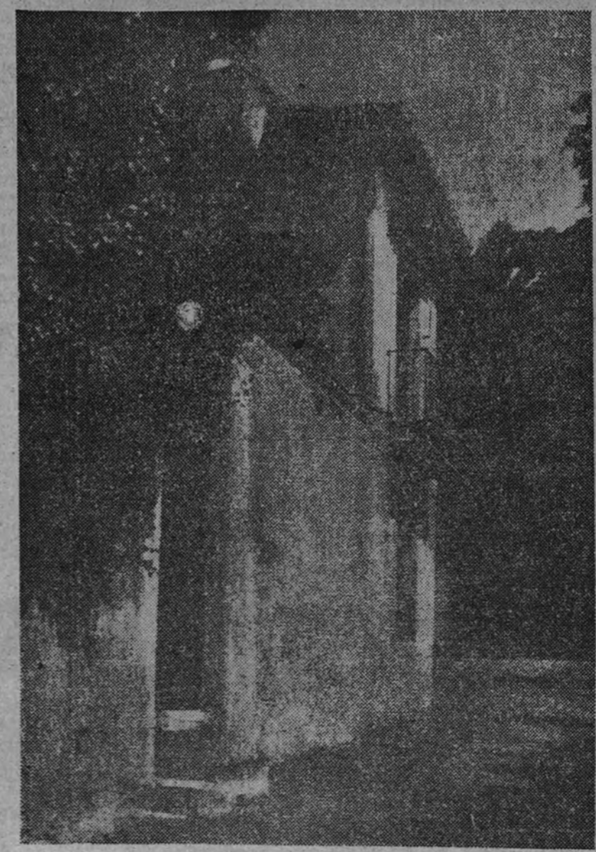
La residencia granadina del maestro Falla

Estámos en 1936. Ante la sorpresa de muchos, la incompreensión de bastantes, y el frenesí entusiasta de un núcleo selectísimo, se estrena el «Concierto para clavicémbalo», obra de un asceta, un místico de la sonoridad. Orquesta pequeña, hiriente, de puro clara; mezcias de desembarazo y de sumisión al pasado, de sintezación sonora y atrevido armónico... Scarlatti, y el siglo XX, fundidos, equilibrados en una tentativa genial... Después, «La Atlántida». ¿Llegaremos a conocer lo escrito? ¿Qué lugar ocupará dentro de la producción total del genio que la fecundó? En cualquier caso, Manuel de Falla, pasado y presente de la música española, figura representativa de sus esencias y virtudes máximas, pertenece también, por su obra, a nuestro futuro. Su nombre sin mácula, su ejemplar probidad, su tenacidad sin límites, han de ser luz y estímulo de cuantos, por asentar el título de compositores españoles, son sus herederos legítimos, sus discípulos, y deben ser sus imitadores.