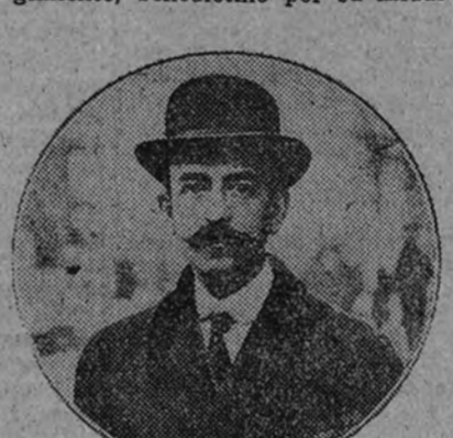
Manuel de Falla en su juventud

Si, en la vida de Falla, pura vida interior, imaginativa, sensible y recogida, no hay grandes acontecimientos. Es una hermosa vida cristiana, sin ruidos, silenciosa, vida serena y ejemplar, atenta sólo a la eterna y suprema Armonía, curada, macerada, a golpes de duro y verdadero sufrimiento, de todos los falsos delirios del artista. «Falla —escribe Ramón Pérez de Ayala— es algo fríasco. Cartujo por su recogimiento, benedictino por su asiduo