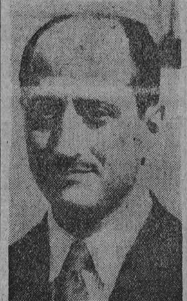
El seleccionador nacional, don Pablo Hernández Coronado, sigue entregado a la más metódica observación.

No podemos olvidar que el equipo de fútbol de España tiene que jugar esta temporada dos partidos fuera de nuestra nación. Dos partidos que, a juzgar por los últimos resultados obtenidos, han de ser bastante difíciles. Si el fútbol español fuese menos glorioso, estos encuentros supondrían una relativa preocupación para los aficionados y para el propio seleccionador nacional. Pero es el caso que el pan de oro de nuestros pergaminos no puede cuartearse con derrotas. La historia exige nuevos trofeos, y a pesar de los progresos evidentes en el juego de conjunto, las victorias son bastante difíciles de lograr. Esta consideración nos lleva a admirar más al seleccionador nacional. A este Pablo Hernández Coronado que observa, vigila, medita y, al final, confirma la impresión que tenía antes de contrar la grave responsabilidad de encontrar los mejores hombres. Y su impresión,