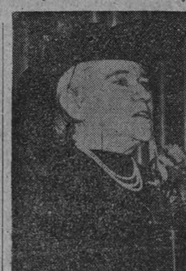
La hermana Kenny