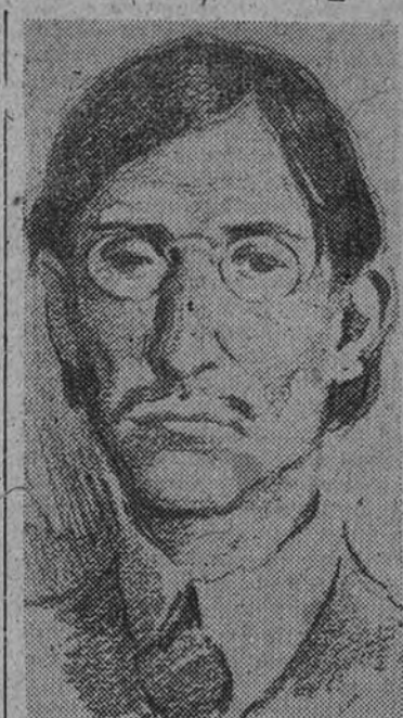
Rafael Arévalo Martínez

Ante una opinión precipitada, Rafael Arévalo Martínez, en Guatemala (1884-1920), es un pobre inválido y casi un ser deficiente. Discreto de todos, no el contacto con la vida, su vida se presenta sujeta a una constante subconsciente de inferioridad, hasta convertirse en un ser profundamente introverso.