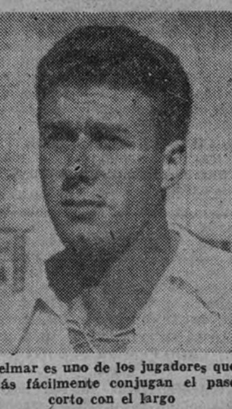
Belmar es uno de los jugadores que más fácilmente conjugan el pase corto con el largo

Por si esto fuera poco, la técnica de penetración, hábil, afilada, con este nuevo sistema de apertura, favorecida por una entrega más veloz de la pelota, se encuentra