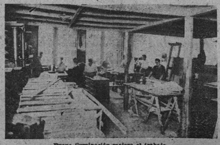
Buena Iluminación mejora el trabajo

Debido a adquirir este Hospital Militar leche fresca de vacas, se admiten ofertas en esta Administración hasta el día anterior de la reunión, por las cantidades y en las condiciones que figuran en su tablilla de anuncios. La Junta se reunirá el día 21 del presente en primera convocatoria y el día 25 en segunda. Madrid, 14 de noviembre de 1946.