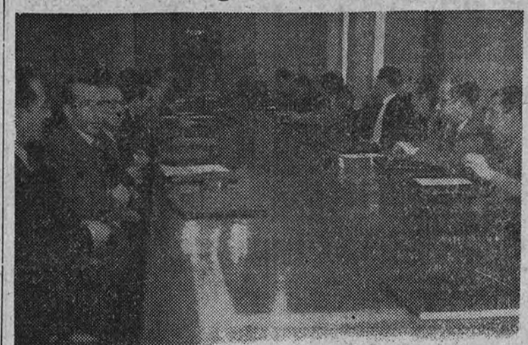
Asistentes a una de las reuniones preliminares del Congreso Nacional de Trabajadores Españoles

Esta tarea, realizada por catorce Comisiones desde agosto, será base de discusión para el Congreso Nacional