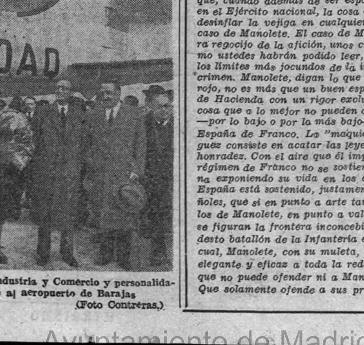
El señor Suñer, con el Ministro de Industria y Comercio y personalidades que acudieron a recibirle al aeropuerto de Barajas.