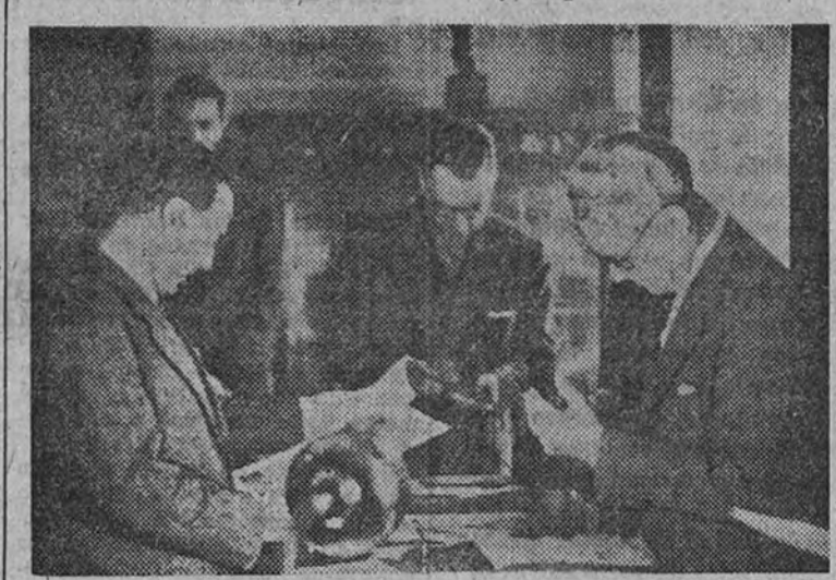
Un momento del acto de entrega de los premios del Concurso Provincial de Artesanía, celebrado ayer mañana en el despacho del Delegado Provincial de Sindicatos, bajo la presidencia de éste

Los galardonados recibieron premios en metálico, medallas y diplomas