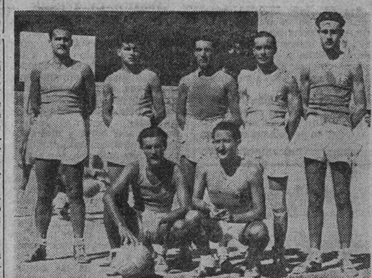
El equipo del Canarias, que al derrotar al del Canoe el pasado domingo ha conseguido en gran manera la clasificación del segundo grupo del Campeonato regional

BALONCESTO.—Resultados de los partidos del Campeonato regional de primera categoría: Primeros equipos: Industrias Químicas, 26; Real Madrid, 39. Canarias, 34; Canoe, 30. Colegio Alemán, 18; América, 21. Reservas: Industrias Químicas, 15; Real Madrid, 34. Canarias, 31; Canoe, 35. Colegio Alemán, 26; América, 21.