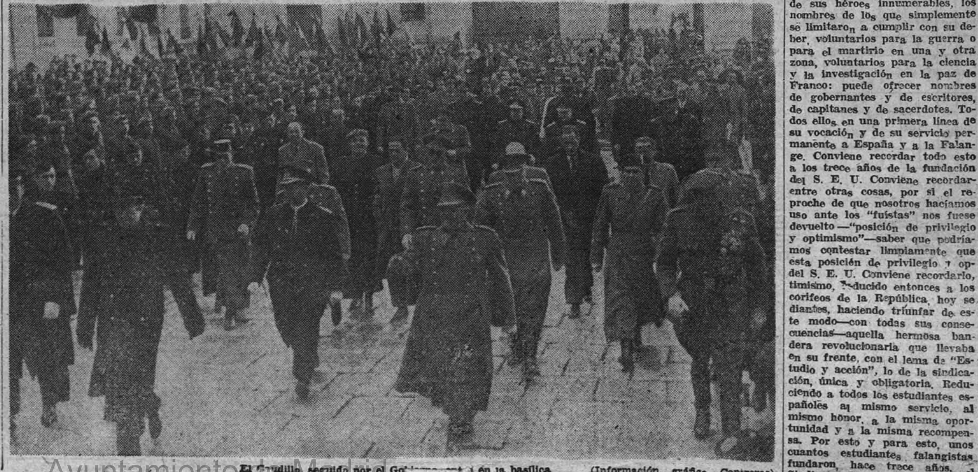
El Caudillo, seguido por el Gobierno y la Guardia de Franco, en la basílica