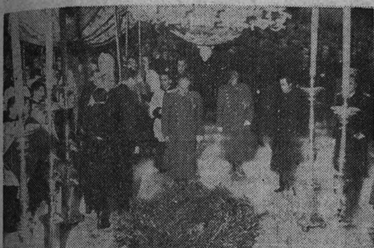
El Caudillo deposita la corona de laurel ante la tumba de José Antonio

En toda España se ha conmemorado con gran fervor el décimo aniversario de la muerte del Fundador de la Falange