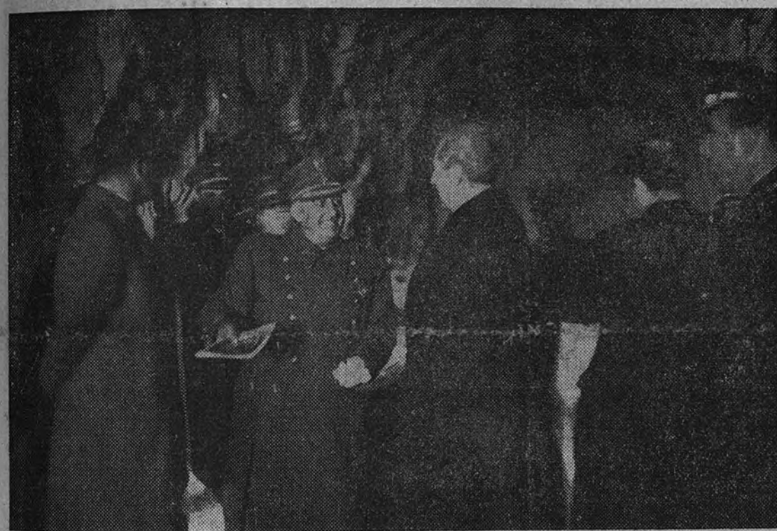
El Caudillo durante su visita a la cripta del Valle de los Caídos después de la solemne ceremonia celebrada en la basílica de El Escorial