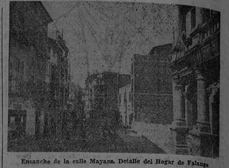
Ensanche de la calle Mayana. Detalle del Hogar de Falange

Y en el orden material, desde luego, concepto como nuestra primera, más importante y trascendental obra, por su ámbito so-