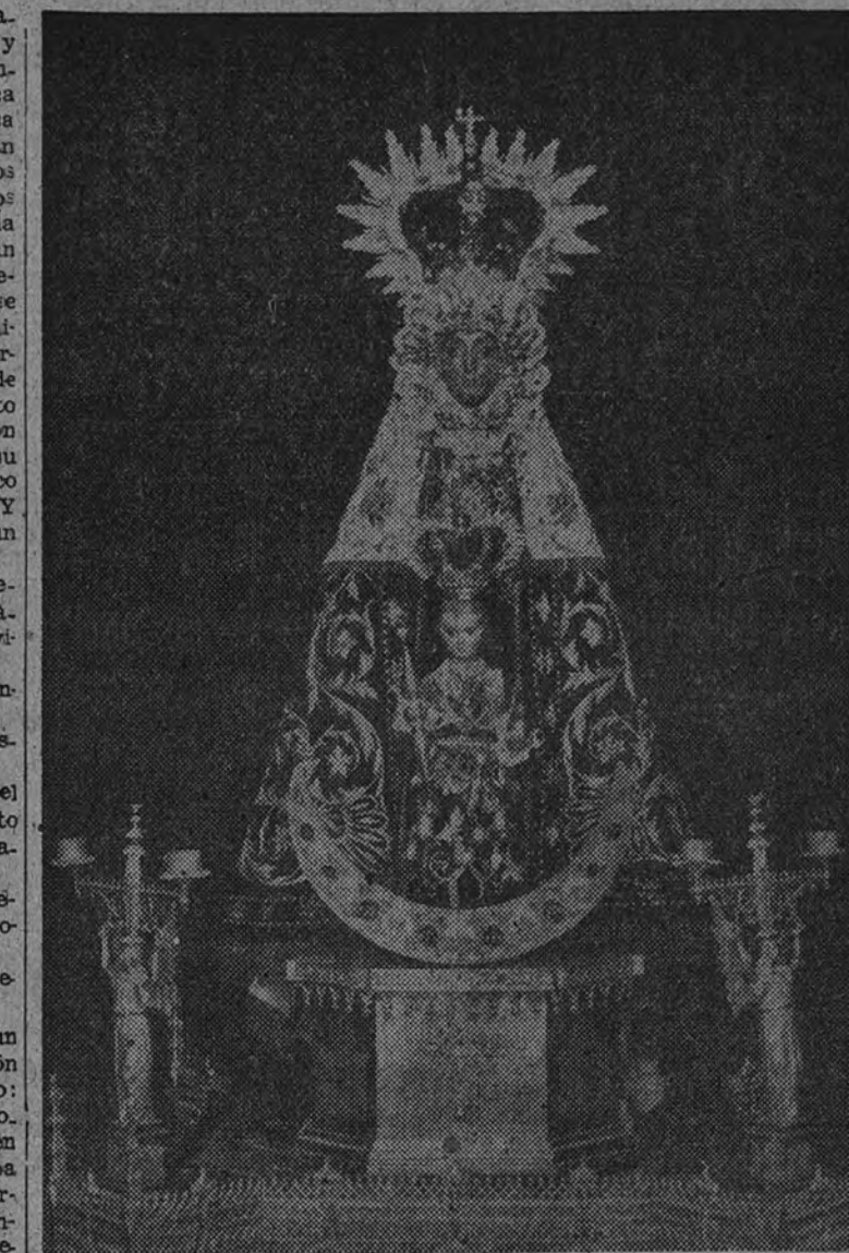
Nuestra Señora de Tiscar, Patrona de Quesada.

Hemos llegado a Quesada. Dejamos el coche que nos conduce y a tontas y a locas salimos andando hasta llegar a una magnífica plaza, en donde una gran masa de lugareños fuman y charlan mientras pasean con las manos metidas en los profundos bolsillos de sus peludas pelizas, que es la prenda de abrigo más usual, sin duda por lo práctica, entre los quesadenses. La plaza en cuestión se eleva un metro largo sobre el nivel de la calle, y en ella se advierte un monumento con un busto de color de cobre del hijo predilecto de Quesada, el ilustre pintor don Rafael Hidalgo Caviedes. A su espalda, un quinceo más blanco que la nieve para la música. Y bancos. Y muchos árboles. Y un piso excelente.