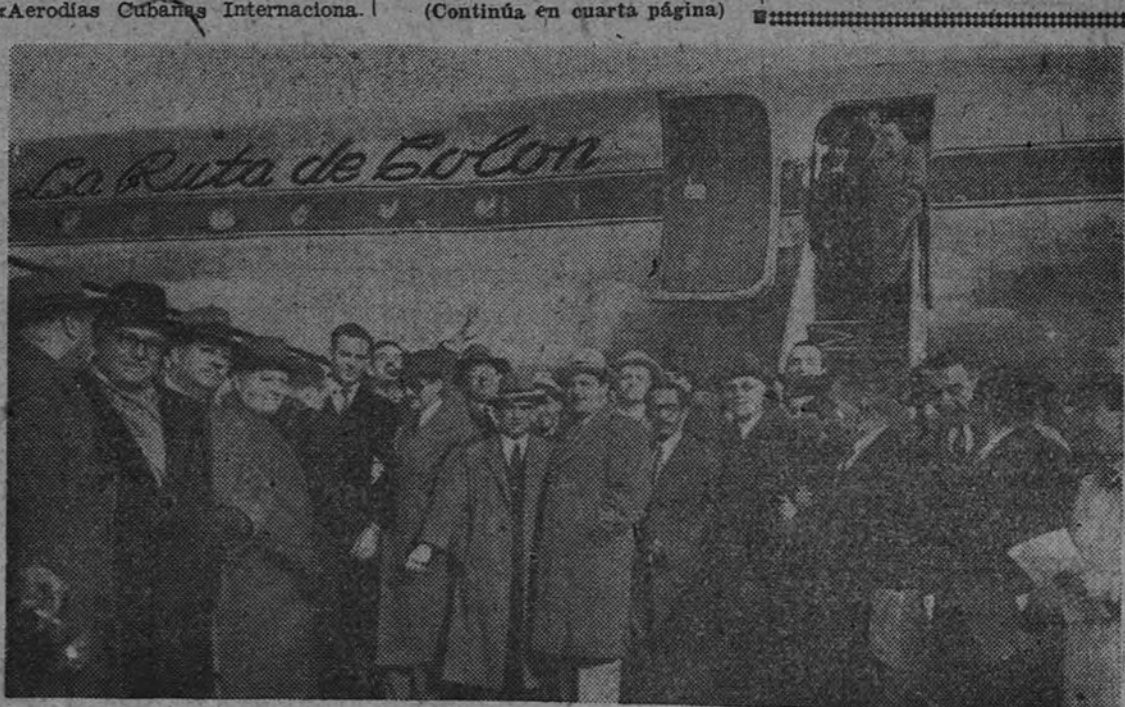
Los periodistas cubanos y demás viajeros de «La Ruta de Colón» en el momento de descender del aparato en el aeropuerto de Barajas

Organizado por la Asociación Benéfica del Ministerio de la Gobernación se celebrará un solemne funeral en el cuartel de los funcionarios fallecidos de dicho Ministerio mañana, día 28, a las doce de la mañana, en la iglesia de los Padres Redentoristas, Manuel Silveira, 14, y se invita por la presente nota, en nombre de los exco- putados señores Ministro y Subsecretario del Departamento, a todo el personal dependiente de dicho organismo y a las familias de los fallecidos.