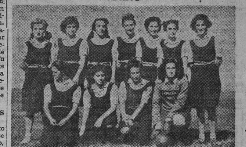
El equipo de San Sebastián, después de ganar dos años a Guadalajara, ha cedido a éste el título el pasado domingo

En la final de segunda, Santander venció a Cuenca