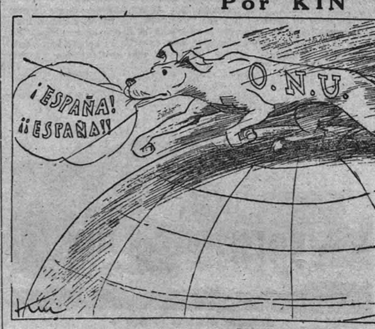
La causa y el efecto