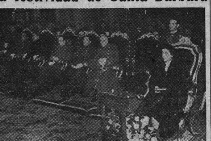
La esposa del Caudillo, con los Ministros, en la presidencia de la solemne función religiosa celebrada en la iglesia de Santa Bárbara con motivo de la festividad de la Patrona de la Artillería.