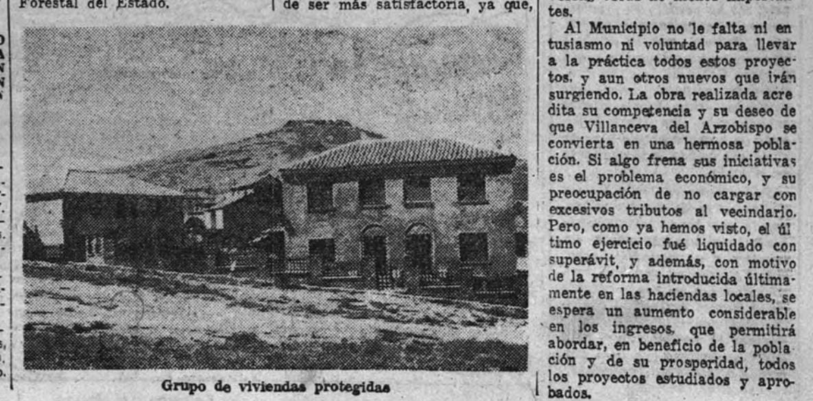
Grupo de viviendas protegidas