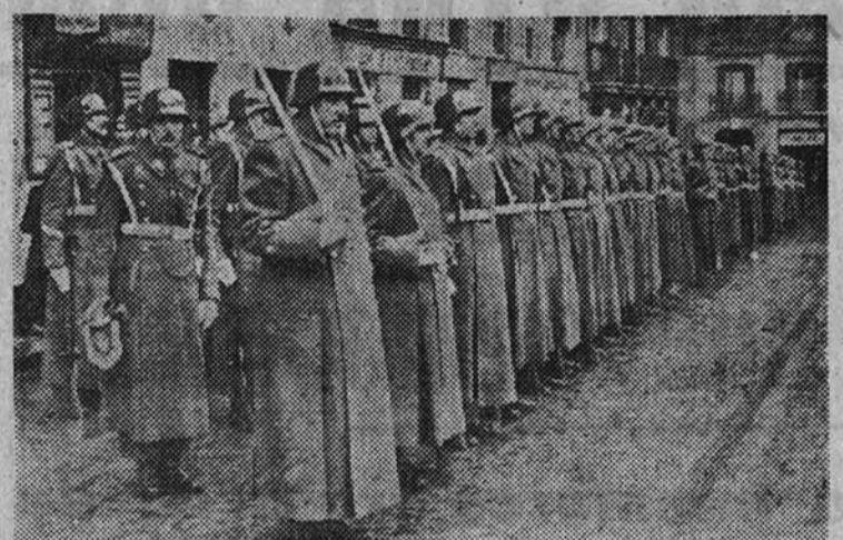
Fuerzas del regimiento de Artillería 71 que formaron ante la Iglesia de Santa Bárbara para rendir honores.

ZARZUELA .—(Compañía María Fernanda Ladrón de Guevara con Amparito Rivelles). 7: Mancha que limpia (de Echegaray). Última representación. Noche, no hay función.