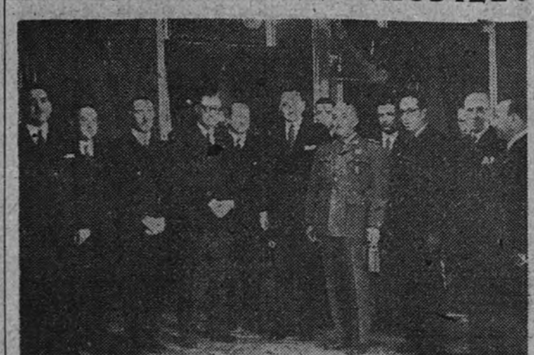
Su Excelencia el Jefe del Estado don Francisco Franco, acompañado de los miembros de la Junta Económica del Sindicato Textil, a quienes recibió en el Palacio de El Pardo. (Información en última página).