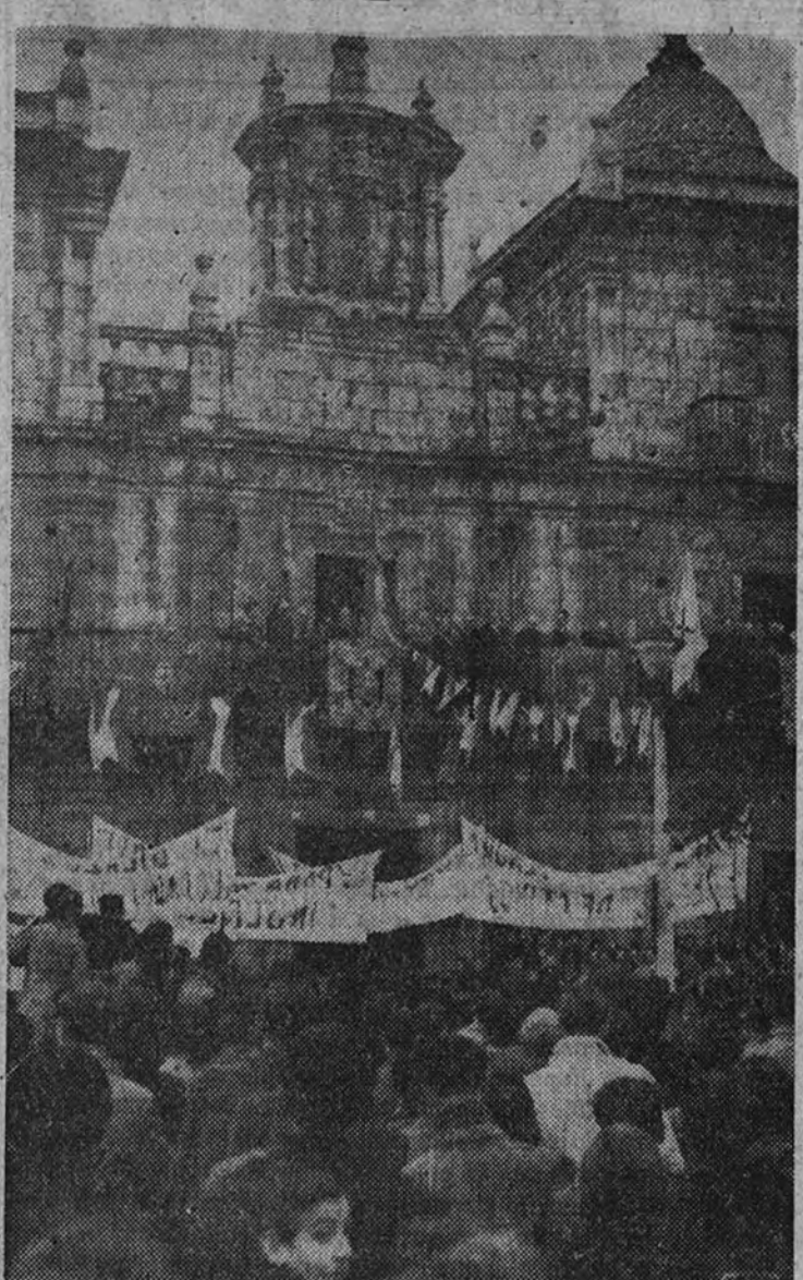
Los Ministros de Obras Públicas y de Industria y Comercio presencian desde el balcón del Ayuntamiento de Ponferrada la imponente manifestación de los habitantes de esta localidad contra la intromisión extranjera

Séptimo. El pueblo español no prescinde con eso de ninguna de sus urgencias. Las mantiene todas en pie. Pero sitúa cuerdamente a la cabeza la primera condición de su prosperidad y de sus lucidos, esa condición tan bien representada y servida por el Caudillo: la valentía, la libertad y el honor.