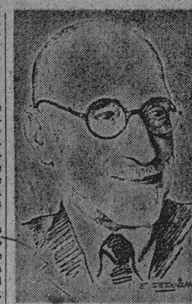
Don Jacinto Benavente

—Es la primera vez que en mis ochenta años de existencia acudo a una manifestación. Y en este caso he acudido porque se ha planteado, ahora como nunca, el dilema de España o no España. Esto es lo que había que afirmar con nuestra presencia en la grandiosa manifestación del pasado día 9. Por esto creí que todas las personas decentes debíamos recorrer las calles de Madrid para dar al mundo el ejemplo de nuestra