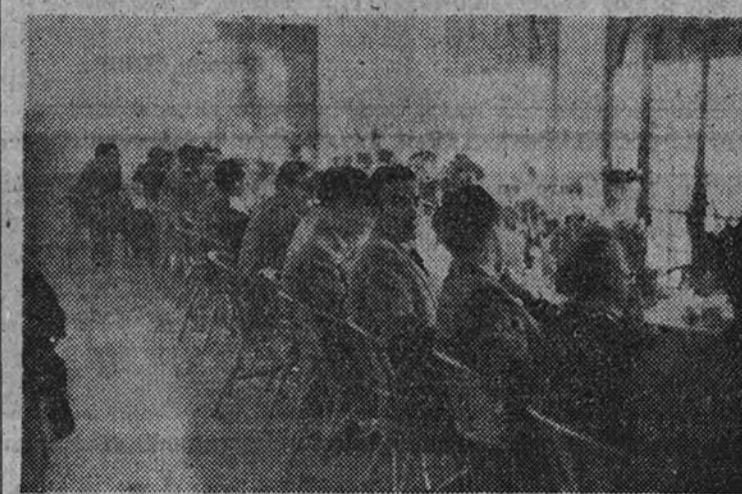
Otro grupo de asistentes

Si se vende o se traspaasa algún horno, el Grupo se queda con él, con lo que se reduce el número de los que funcionan en la provincia, y así, de esta forma, puede afrontarse con mayor facilidad el proyecto de mejorar