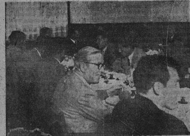
Homenaje al Jefe Provincial del Grupo de Horneros de Gerona