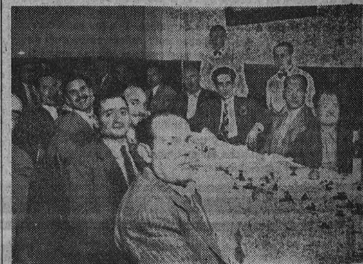
Asistentes al acto en honor del Gobernador

El acto, en resumen, sirvió para poner de manifiesto, como decíamos al principio, los inmejorables resultados que se desprenden de una íntima colaboración entre dirigentes y dirigidos, cuando en sus relaciones predomina la mejor voluntad y la más absoluta sinceridad. Un acto, en definitiva, demostrativo de la armonía y convivencia que reina entre los gerundenses y que en muchos casos podría servir de enseñanza y ejemplo.