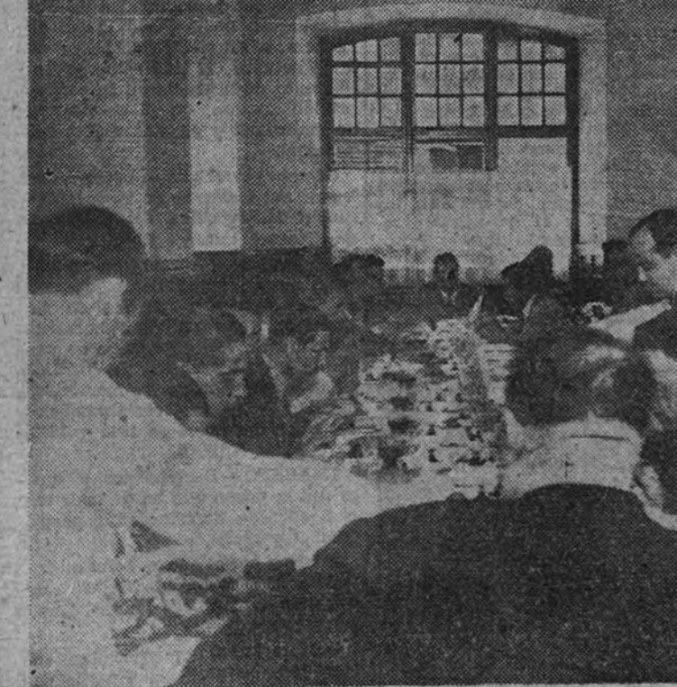
Homenaje tributado al Gobernador y Jefe Provincial