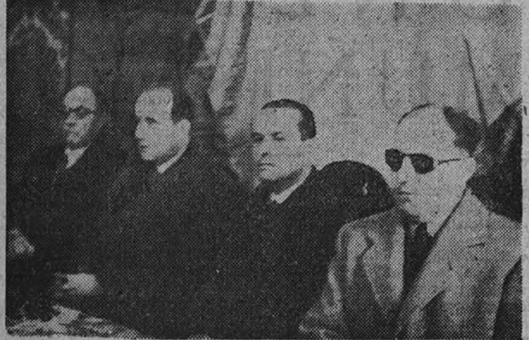
El Ministro de la Gobernación preside el acto inaugural del nuevo edificio de la Jefatura Nacional de Ciegos

En nombre del Caudillo, fervorosamente aclamado, el Ministro ofreció continuar el apoyo a esta obra modelo