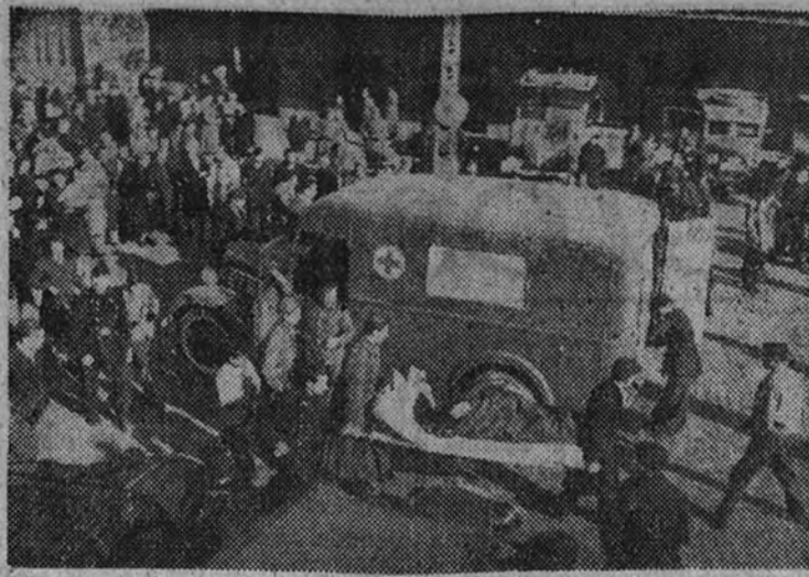
Los heridos son transportados a las ambulancias

PARTICIPA que hoy miércoles, a las diez y media de la mañana, y en la iglesia parroquial de San José, de esta capital, se celebrarán funerales por el eterno descanso de su alma.