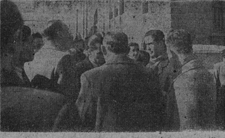
El Ministro de Agricultura conversa con sus familiares, que han llegado en el tren de socorro y han resultado ileso

EL PRIMER CONVOY DE HERIDOS LLEGO AYER A MADRID