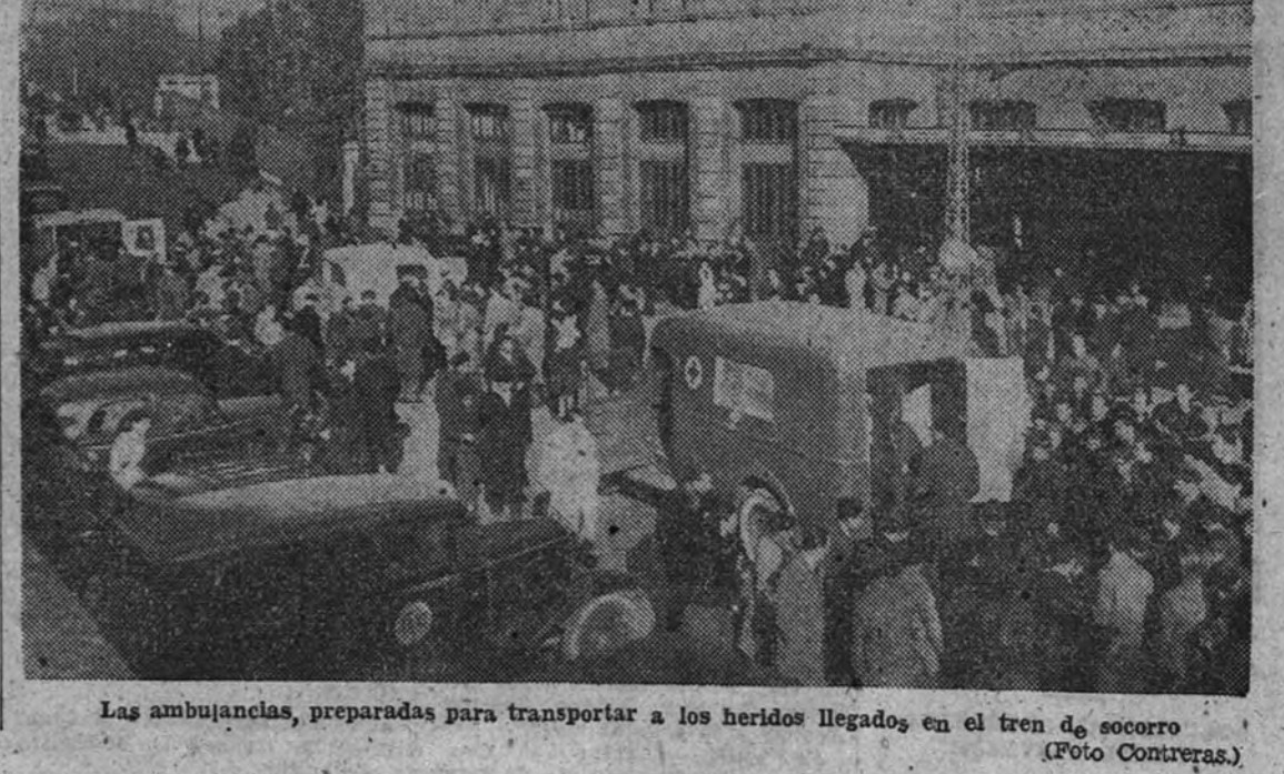
Las ambulancias, preparadas para transportar a los heridos llegados en el tren de socorro

—Ya partirán las mujeres! Quizá excesivamente ostentoso para una pancarta este grito, en el que se traduce la voluntad trascendente de independencia de todo un país, es la mejor medida de la calma con que los españoles podemos esperar el vencimiento de todos los plazos razonables; pero que sabemos que para aquella voluntad ni hay plazo ni hay más razón que su razón.