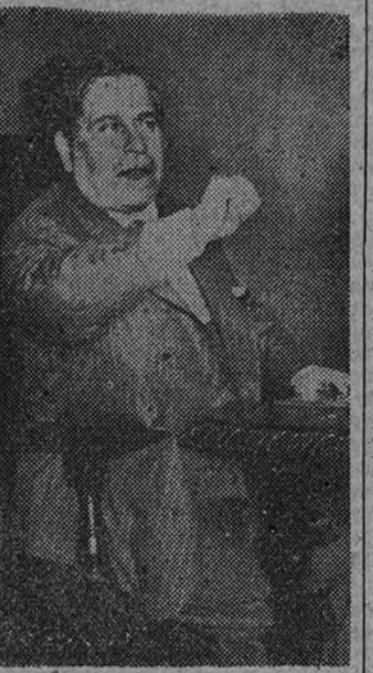
Nuestro colaborador Ramón Gómez de la Serna, durante la conferencia que, sobre el tema «Azorín y su obra», pronunció en la clausura de la Exposición del Libro Español, celebrada en Buenos Aires

Una conferencia de Ramón Gómez de la Serna