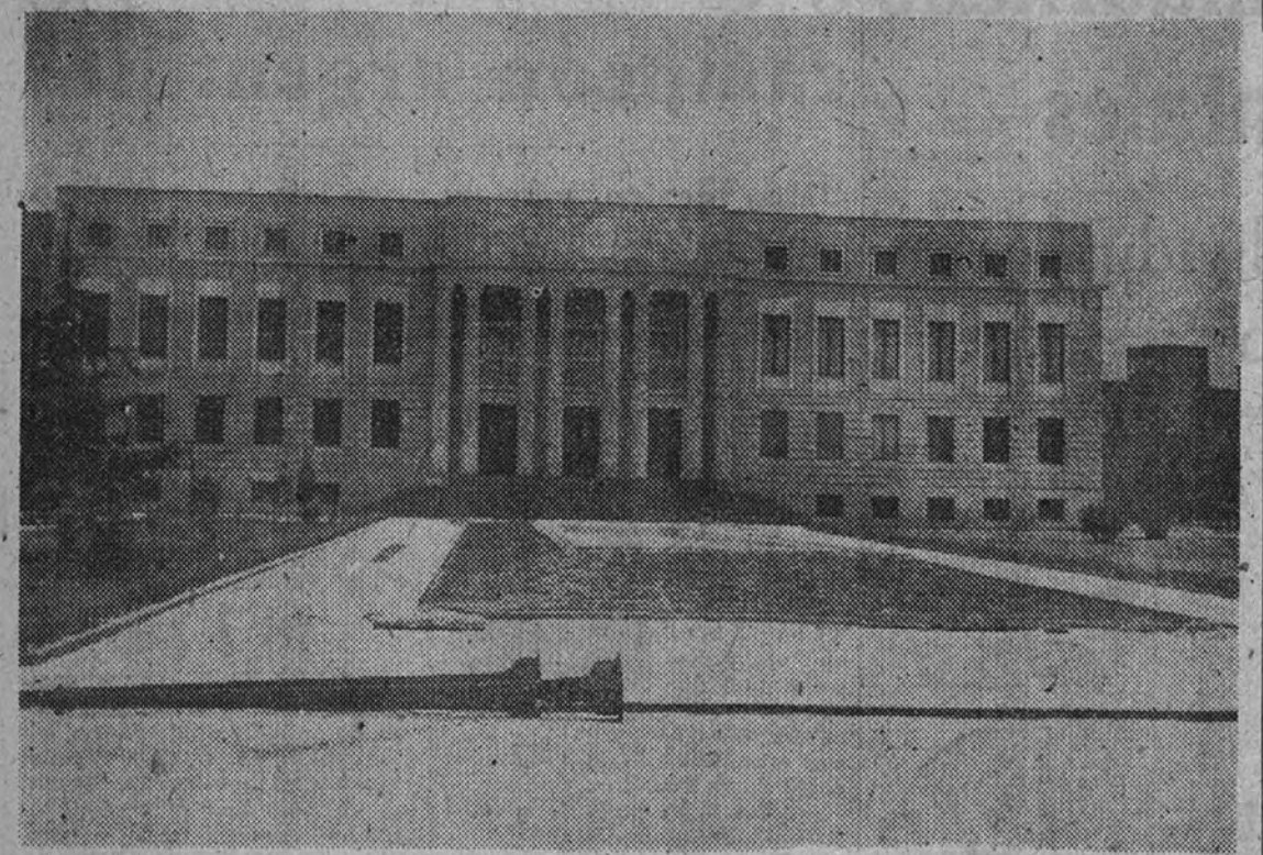
Los nuevos edificios del Consejo Superior de Investigaciones Científicas se vieron ayer cubiertos de nieve por primera vez en este invierno.

NUMEROSOS PUEBLOS DE ALBACETE SE HALLAN INCOMUNICADOS POR LA NIEVE