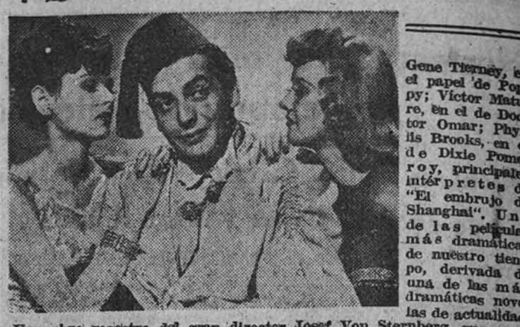
Una obra maestra del gran director Josef Von Sternberg, que mañana miércoles estrenará el lujoso cine Rex

MAÑANA ESTRENA EL REX LA FORMIDABLE PELICULA «EL EMBRUJO DE SHANGHAI»