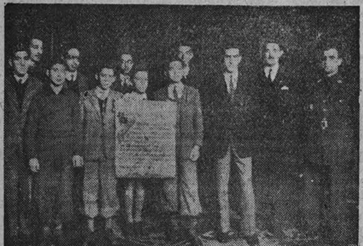
La Comisión de alumnos del Instituto «Cervantes», portadora del pergamino de homenaje y adhesión al Caudillo que ayer entregó al Ministro de Educación. La acompañó una representación del profesorado y del Frente de Juventudes.

Ayer entregaron al Ministro de Educación un pergamino dedicado a Su Excelencia