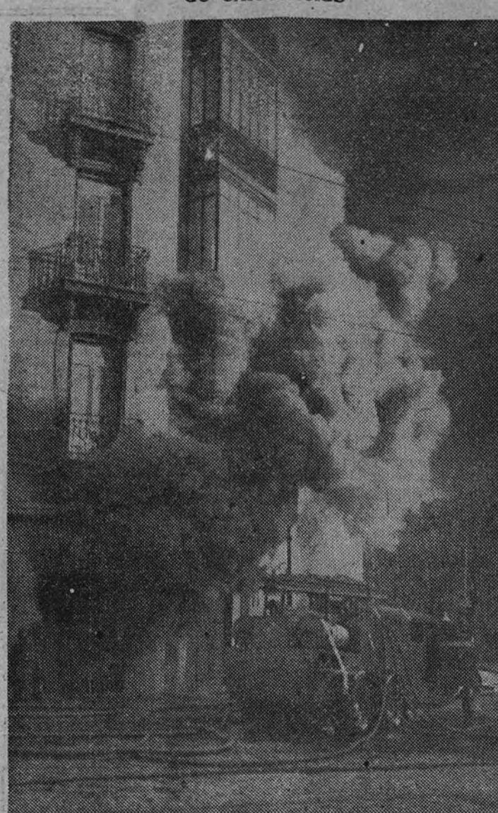
Los bomberos trabajan para dominar el siniestro

Quedaron destruidas veintidós toneladas de existencias