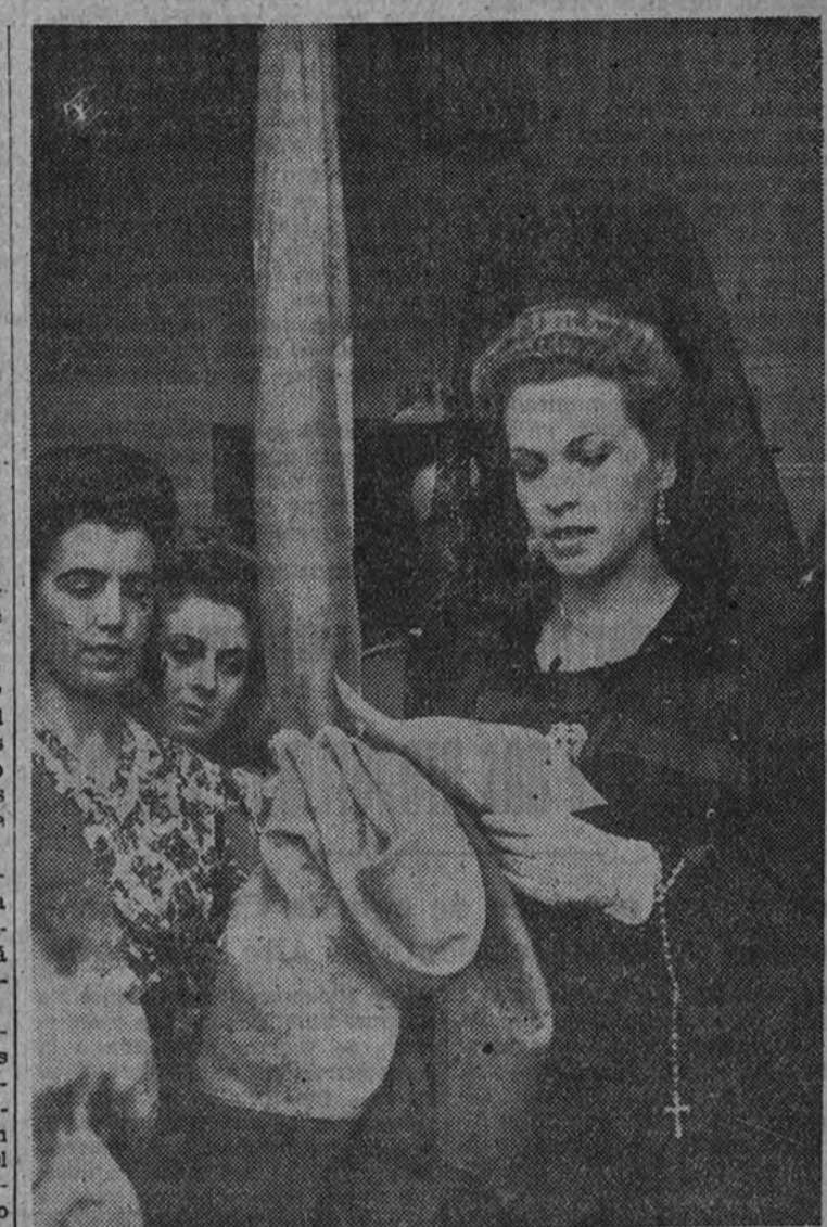
Acto de entrega de la bandera de la Guardia Civil al pueblo de Villanueva