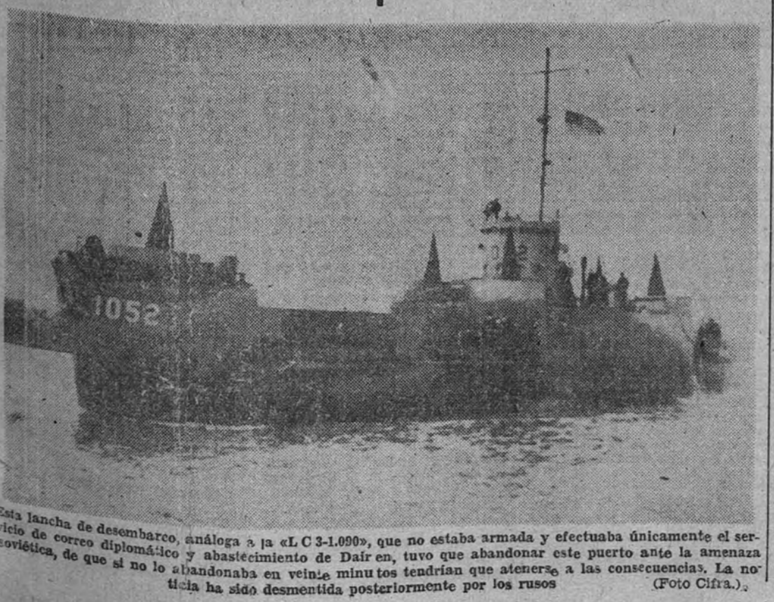
Esta flota de desembarco, análoga a la «C-13.000», que no estaba armada y efectuaba únicamente el servicio de correo diplomático y abastecimiento de Dairen, tuvo que abandonar este puerto ante la amenaza soviética, de que si no lo abandonaba en veinte minutos tendrían que atender a las consecuencias. La noticia ha sido desmentida posteriormente por los rusos.