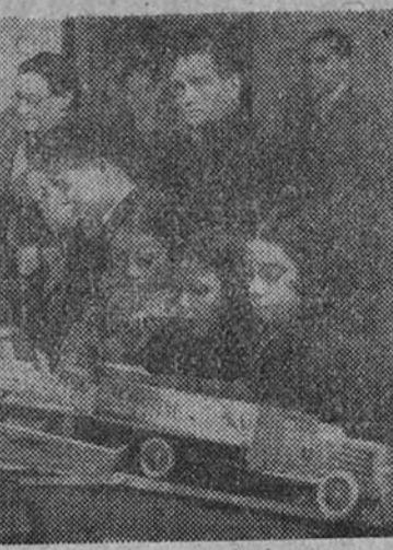
Reparto de juguetes en la Asociación de la Prensa el Día de Reyes