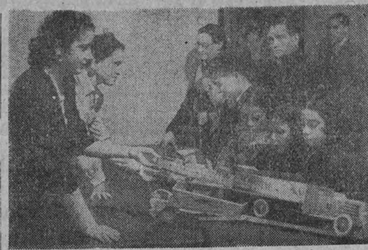
Reparto de juguetes en la Asociación de la Prensa el Día de Reyes