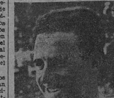
El uruguayo Scarone y el húngaro Platko ejercieron saludable influencia en el equipo español en la defensa.