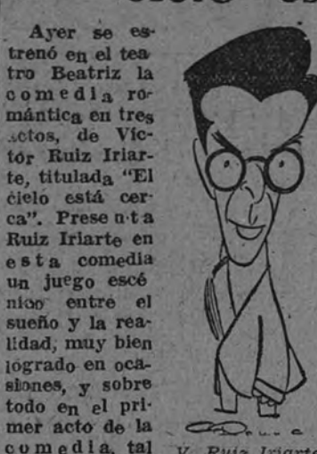
V. Rius Iriarte

Ayer se estrenó en el teatro Beatriz la comedia romántica en tres actos, de Víctor Ruiz Iriarte, titulada "El cielo está cerca". Presente a Ruiz Iriarte en esta comedia un juego escénico nuevo entre el sueño y la realidad, muy bien logrado en ocasiones, y sobre todo en el primer acto de la comedia, tal vez el de mejor traza y el más logrado desde el principio hasta el fin. La comedia, en líneas generales, está pensada con cierta originalidad y con fino sentido de la poesía; pero también es cierto que en algunas ocasiones, tal vez porque el autor ha querido llevar la comedia a terrenos de más complejidad que los que en el comienzo de la obra se insinúan, adolezca, por estas razones, de falta de ligereza, y la construcción de la obra, en este sentido, tampoco logra tan marcada justicia como en el primer acto de la comedia.