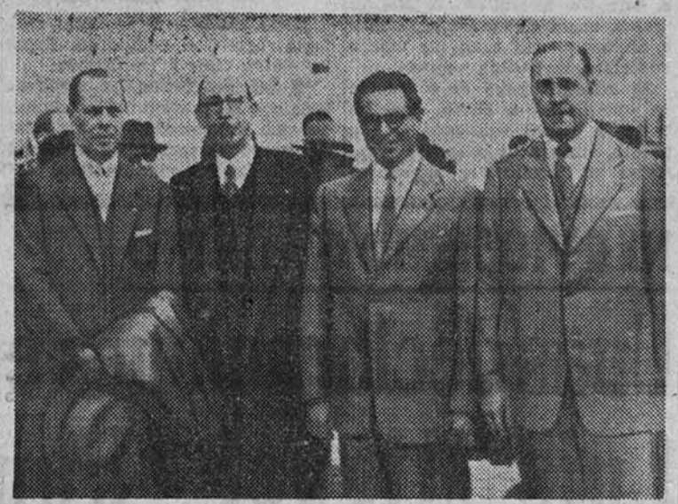
Los nuevos embajadores de la República Argentina en España e Italia, señores Radio y Ocampo, respectivamente, acompañados del cónsul de su país en Tenerife y del presidente accidental del Cabildo, a bordo del «Cabo de Buena Esperanza», atracado en el muelle de Santa Cruz