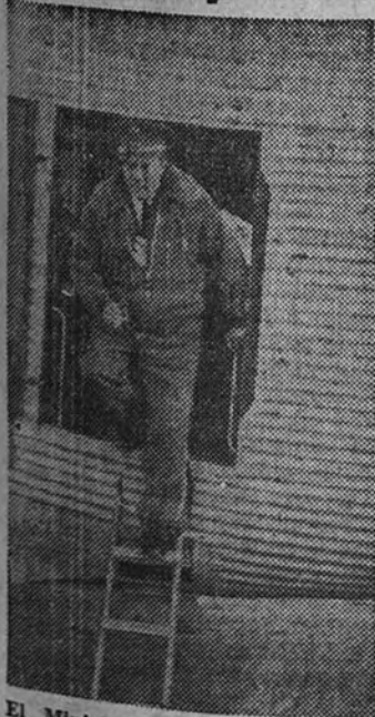
El ministro desciende del avión que, tripulado por él, inauguró la nueva pista del aeropuerto de Barajas

En ella tomó tierra un avión pilotado por el Ministro del Aire