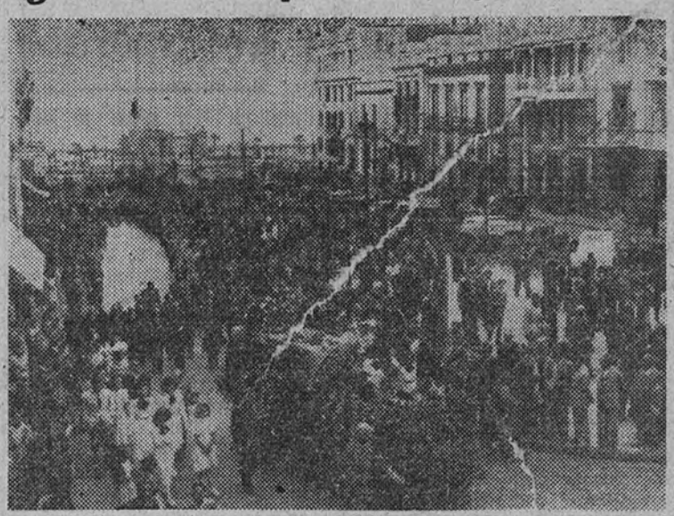
Los restos de Falla son trasladados desde el «Cabo de Buena Esperanza» al Ayuntamiento de Santa Cruz de Tenerife, en cuyo lugar recibieron el emocionado homenaje de la población

A la fructificar aquella semilla de la primera Falange Femenina española, se encontró con un mundo de inspechadas realidades que hasta entonces sólo figuraban en el más recóndito del sueño de los que querían una Patria hermosa, con el renacer a las buenas costumbres tradicionales, de una finura de maneras y gustos, de una asistencia a los desvalidos, tanto de la fortuna como de la educación. Pasada la guerra, pasadas las horas trémulas del auxilio a los heridos y enfermos, a los damnificados por ella, niños y mujeres, la Sección Femenina demostró que no había terminado su papel, sino que justamente entonces comenzaba. La Falange no era una reclusa marcial. Al impetuoso bético supo responder con estilo muy propio, por cierto, con el patriotismo (Continúa en cuarta página.)