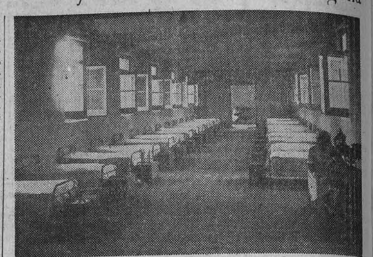
Uno de los dormitorios

SOL. 11 mañana: La película más original y sorprendente: Semilla de odio (Anne Baxter, Ralph Bellamy). Completa el programa: El crimen de la calle de Bordadores (Manuel Luna-Mary Delgado).