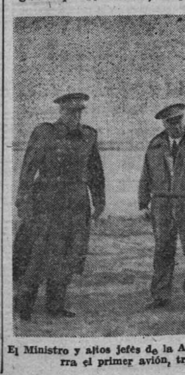
El ministro y altos jefes de la Aviación en la inauguración de la nueva pista, después de haber tomado tierra el primer avión, tripulado por el ministro, general don Eduardo González Gallarza