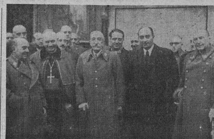
El Ministro del Ejército con las personalidades que asistieron a la entrega de la Medalla de Oro de Madrid al Museo del Ejército

Las liquidaciones de este artículo serán presentadas por los almacenistas el día 14 del actual en el Círculo Obrero de Cereales, Grupo 2.º, Salvado, sito en Marqués de Cubas, 23 y, a su vez, el Círculo, con relación de cupones servidos por cada almacenista, en esta Delegación.