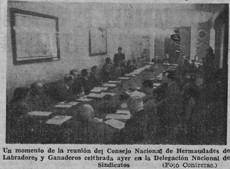
Un momento de la reunión del Consejo Nacional de Hermandades de Labradores y Ganaderos celebrada ayer en la Delegación Nacional de Sindicatos

Se aprobó el anteproyecto de ley sobre la estructura sindical del campo