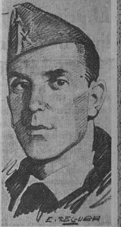
El excelentísimo señor don Siro Alonso Alonso, general de división, nombrado recientemente Gobernador Militar de Madrid, nació en Benibarré (León) en 1885; ingresó a los catorce años en la Academia de Infantería de Toledo, de la que salió segundo teniente en el año 1913. En 1915 ascendió a primer teniente, con cuyo grado pasó a las fuerzas de África, incorporándose a la Policía indígena de Melilla en el año 1918. Un año después pasó a las fuerzas de la Policía indígena de Larache, ascendiendo a capitán, el mismo año de 1919. En el año 1921 pasó a la Segunda Bandera del Tercio de Extranjeros, formando parte con brillante actuación en toda la campaña africana de 1921, siendo herido de gravedad en una pierna el mismo año 21. Por méritos de guerra fué ascendido a comandante en esta misma campaña. En el año 1922 fué comisionado por el Gobierno para visitar diversos puntos de la Europa central y oriental, partiendo por Belgrado y regresando después a Melilla para continuar la campaña. Al iniciarse el Movimiento Nacional el entonces comandante don Siro Alonso se hallaba en Ribadavia en situación de retirado. Proclamado el estado de guerra en aquella villa creyó oportuno fué nombrado comandante militar de la plaza. Poco después fué confiado el mando de una bandera de la Legión y pasó con la misma al frente de Madrid, ocupando el Cerro de los Angeles. En el año 1937 fué ascendido a teniente coronel, tomando el mando de un regimiento y alcanzando la Medalla Militar colectiva por su brillante comportamiento en los combates de Vaciadad. En el mes de julio de este mismo año pasó a la 150 división, y al frente de una de sus brigadas tomó parte en la batalla de Brunete, ascendiendo a coronel en noviembre del mismo año. Con este empleo, en este mismo año y al frente de la citada 150 división tomó parte destacada en la batalla de Teruel. Tomó igualmente parte en las campañas de Aragón y Cataluña. En julio de 1939 le fué entrado el mando de la 150 división, a cuyo frente y formando parte del Cuerpo de Ejército de Urgel, tomó parte en las operaciones para la ocu-

El decreto del estado de sitio está firmado por el Presidente Morinigo. Mientras esté en vigor el decreto—treinta días—se prohíben las reuniones públicas y la celebración de manifestaciones políticas. (Efe.) DIMITE EL GOBIERNO PARAGUAYO ASUNCION 12.—El Gobierno del Paraguay ha presentado su dimisión, según la agencia United Press. (Efe.)