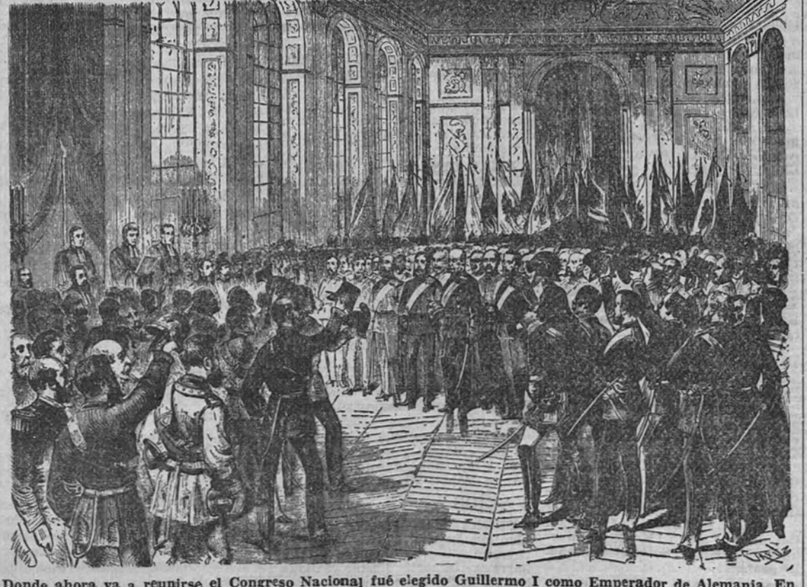
Donde ahora va a reunirse el Congreso Nacional fué elegido Guillermo I como Emperador de Alemania. En este grabado de la época, anterior al cuadro de Anton von Werner, aparece el nuevo Emperador rodeado de sus generales y de los príncipes soberanos del II Reich