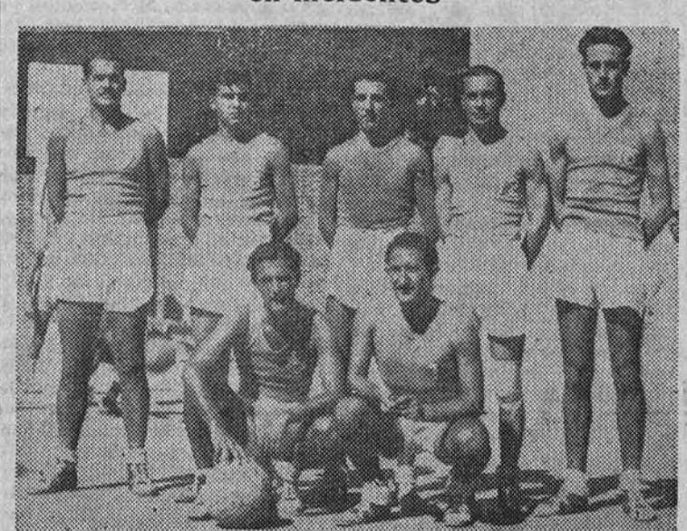
El equipo del Canarias, que el domingo debutó en la Liga, derrotando al Liceo Francés

El encuentro América-Real Madrid fué pródigo en incidentes