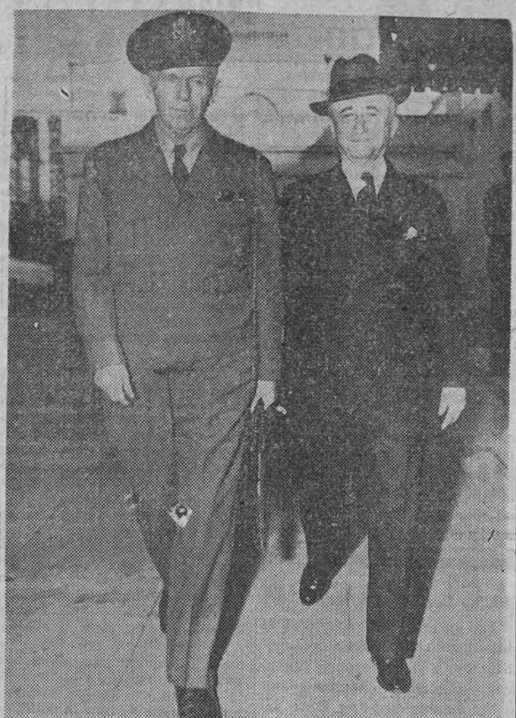
El nuevo secretario de Estado norteamericano, general Marshall, sale de la Casa Blanca acompañado de su antecesor, mister Byrnes. Esta foto fue obtenida en el pasado mes de marzo, al regresar Marshall de uno de sus viajes a China.