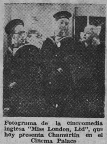
Fotograma de la cinecomedia inglesa "Miss London, Ltd.", que hoy presenta Chamartín en el Cinema Palace

—Señor embajador: Os rogamos transmitir nuestro saludo al general Perón, que cuenta con todas las simpatías del pueblo español. Os hacemos testimonio de nuestro fervoroso cariño a la Argentina y rogamos transmitir este saludo a nuestros camaradas los ferroviarios argentinos.