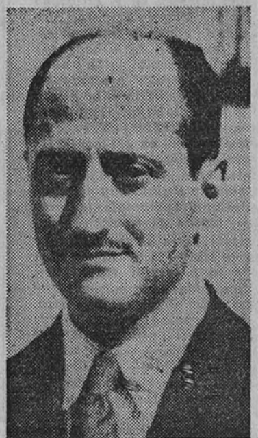
Don Pablo Hernández Coronado, Seleccionador nacional de fútbol

diente ponga en los exámenes, siempre resultará más práctico el estudio durante el curso. Y si en la primera lección de éste se comprueba que no se sabe las asignaturas, lo que hay que hacer no es