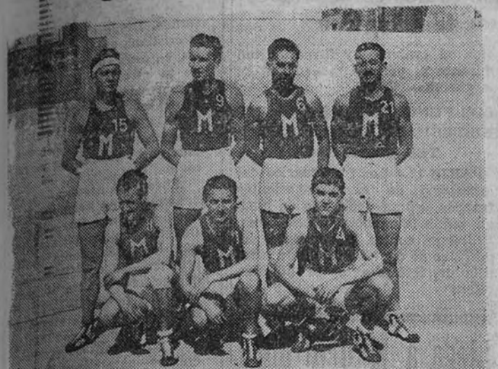
El equipo del Mongat, subcampeón de Cataluña, que hoy se enfrenta con el América, en un interesante encuentro de Primera División

Hoy se jugará el encuentro de Liga América-Mongat